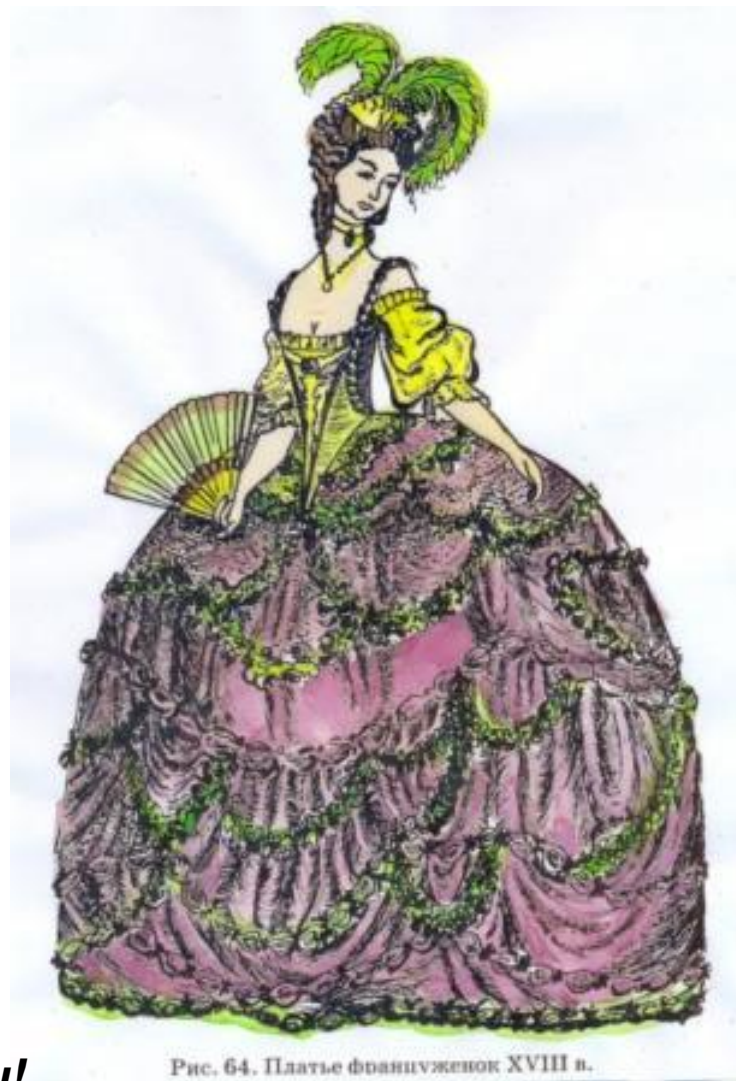
Рис. 64. Платье француженок XVIII в.