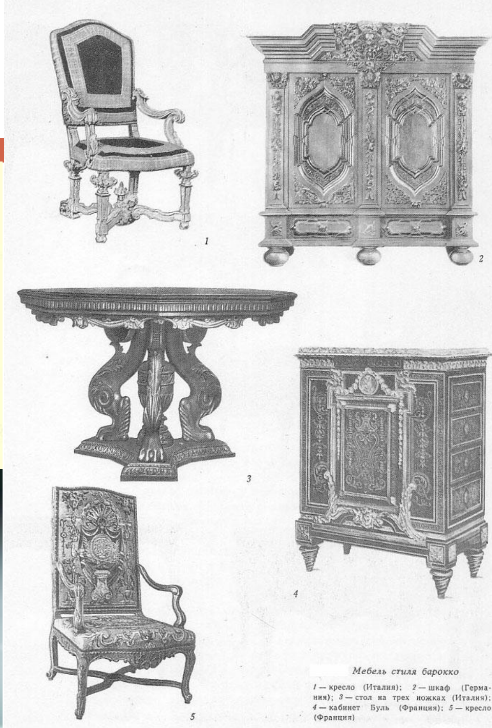
Мебель стиля барокко

1 — кресло (Италия); 2 — шкаф (Германия); 3 — стол на трех ножках (Италия); 4 — кабинет Буль (Франция); 5 — кресло (Франция)