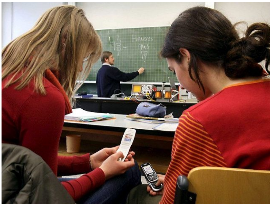
Ученик с телефоном