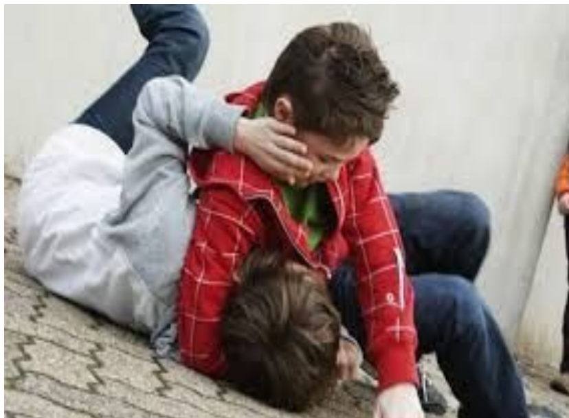
Драка в классе