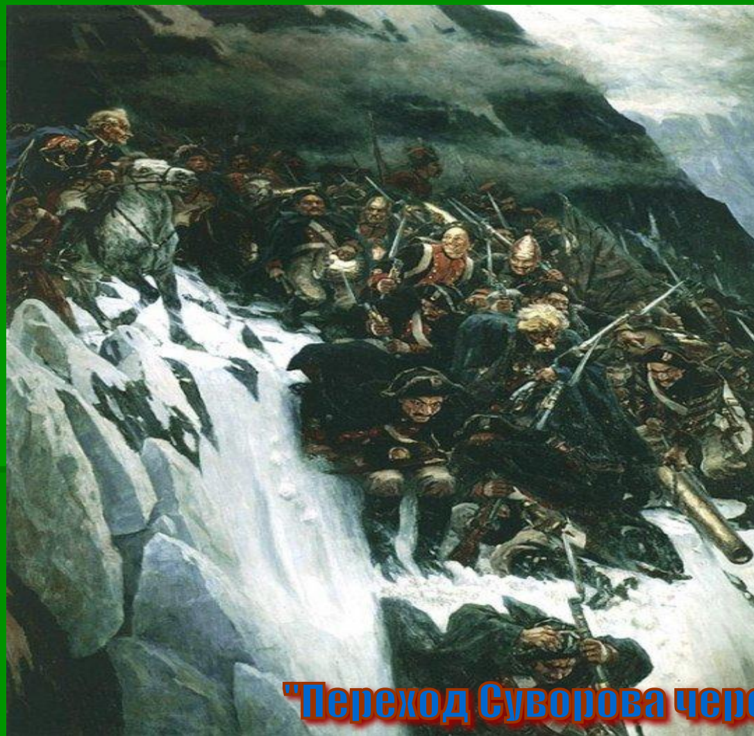
"Переход Суворова через Альпы"

Эта картина посвящена мужеству национальных героев