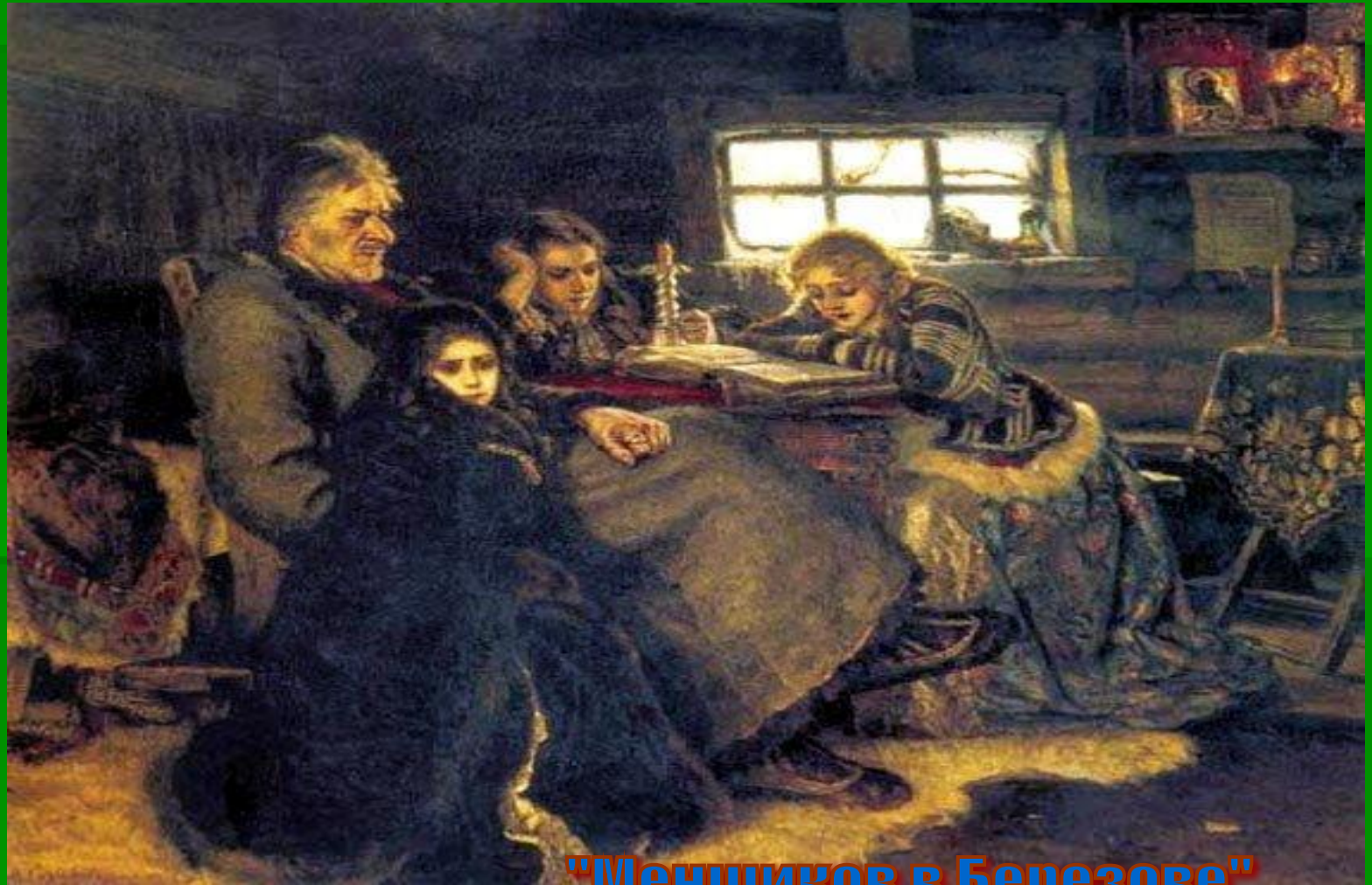
"Меншиков в Березове"

Это излюбленный Суриковым образ русского человека из числа «ярых сердцем, могучих духом»