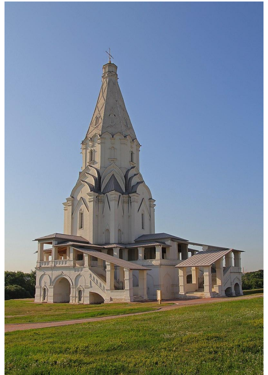
ЦЕРКОВЬ ВОЗНЕСЕНИЯ В КОЛОМЕНСКОМ