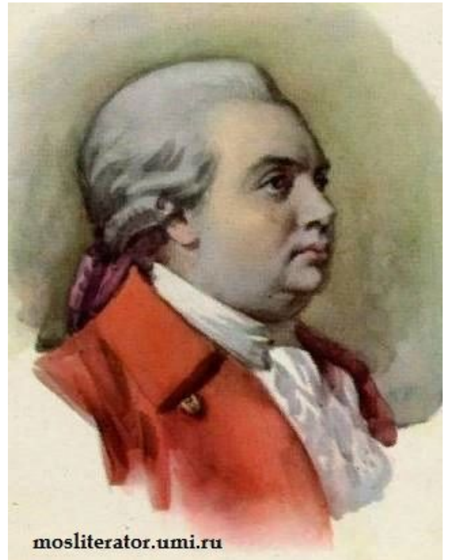
Д. И. Фонвизин