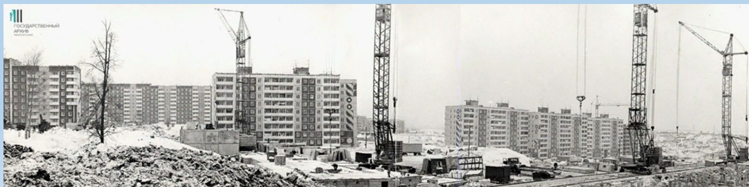
Панорама Садового в 1986