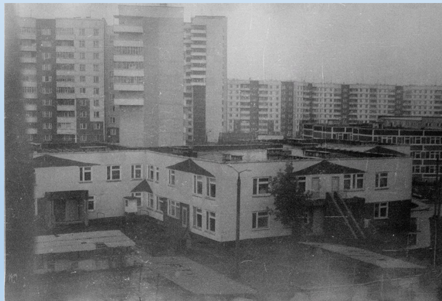
Детский сад во дворе Старцева 1, конец 80-х – начало 90-х