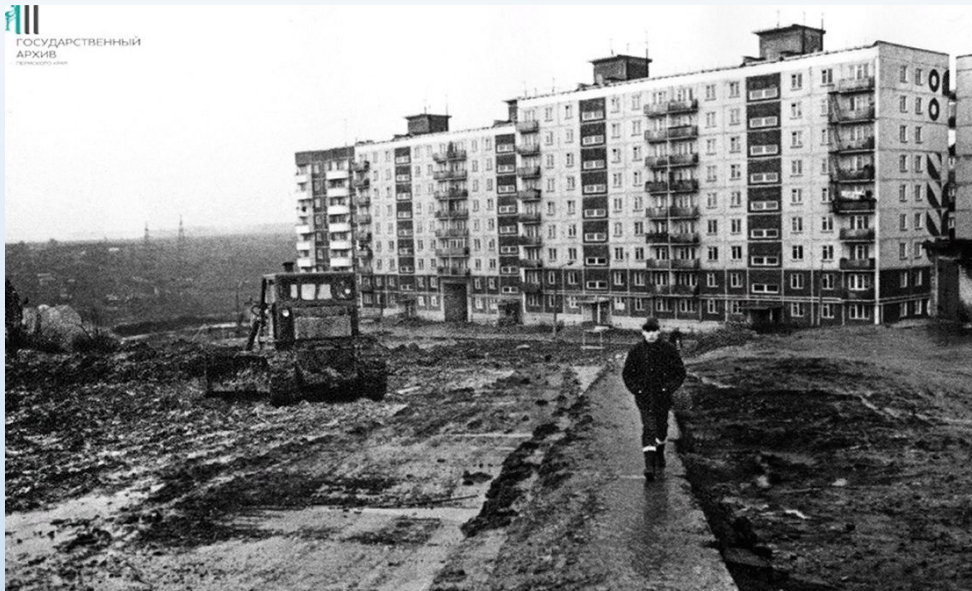
двор домов №9 по ул.старцева.1984 год.

ГОСУДАРСТВЕННЫЙ АРХИВ Республики Беларусь