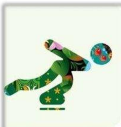
Скоростной бег на коньках