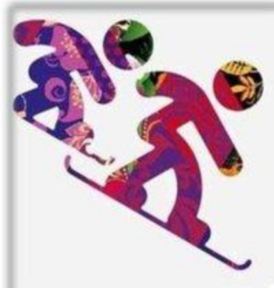
Сноуборд - кросс