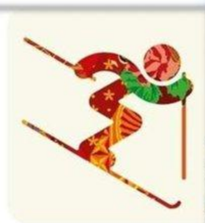
Фристайл - Могул