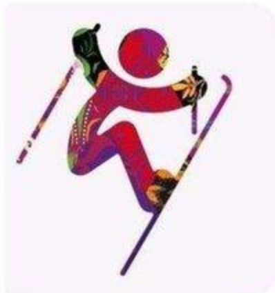
Фристайл - Хафпайп