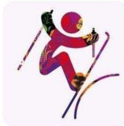
Фристайл - Слоупстайл