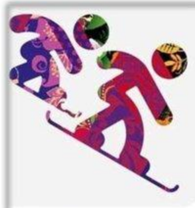
Сноуборд - кросс