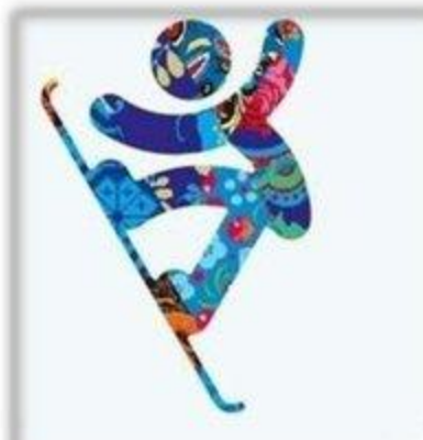
Сноуборд - Хафпайп