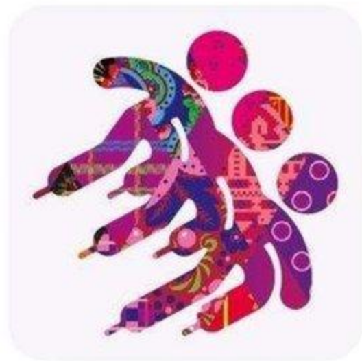
Шорт - трек