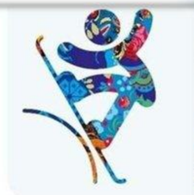
Сноуборд - Слоупстайл