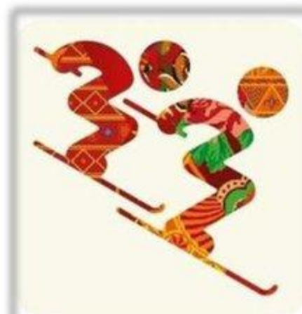
Фристайл - Ски-кросс