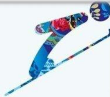
Прыжки на лыжах с трамплина