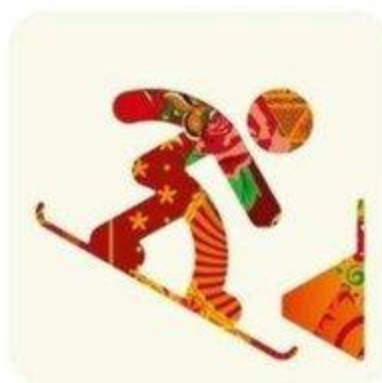
Сноуборд параллельные виды