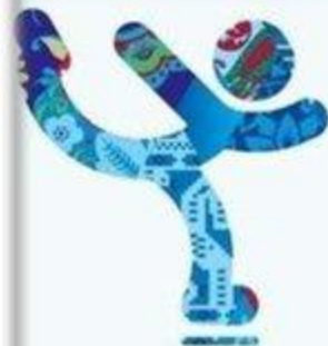
Фигурное катание на коньках