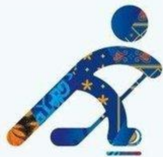
Хоккей на льду