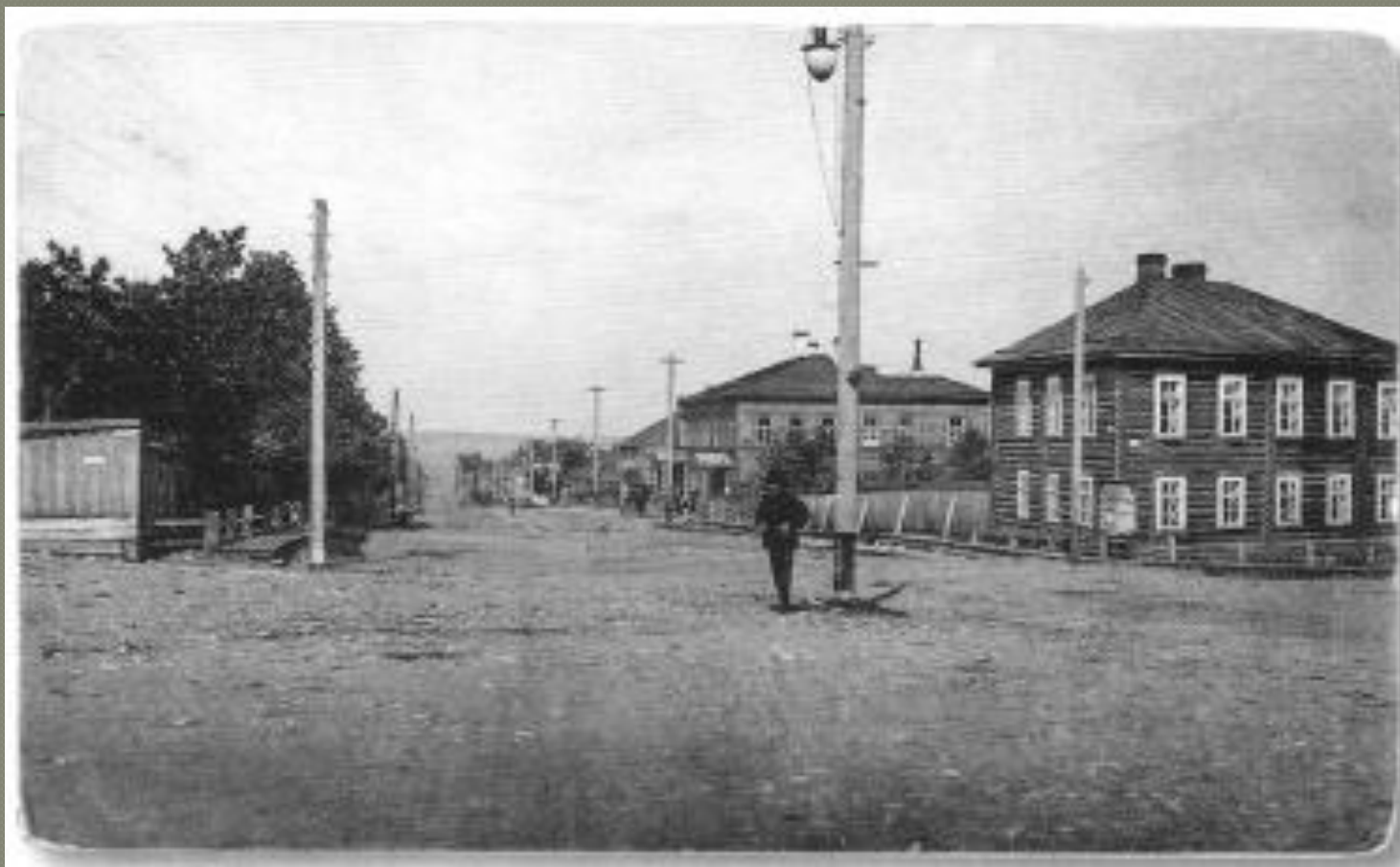
с 1912 года — Бородинская улица