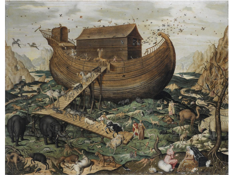
Эдвард Хикс: «Ноев Ковчег» (1846 г.)

Б. 1 год (Быт. 7:13) – срок всех событий