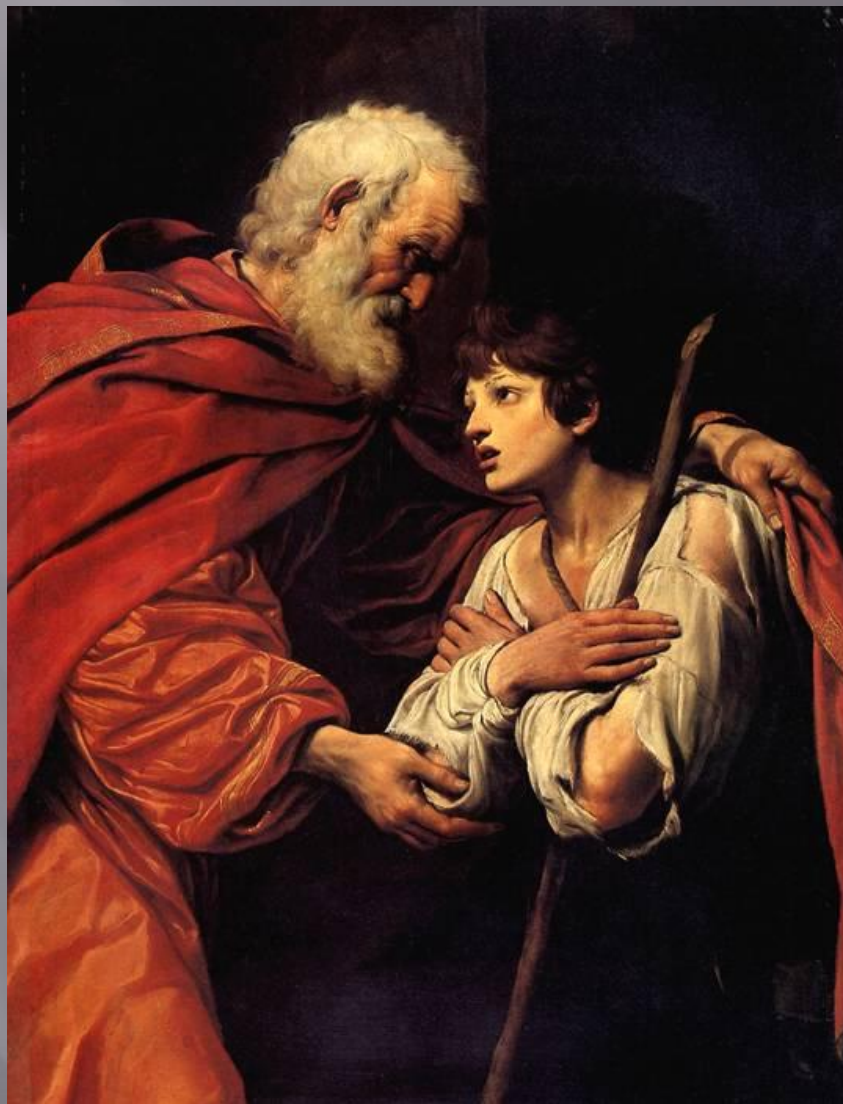
Лувр. СПАДА ЛИОНЕЛЛО Возвращение блудного сына.