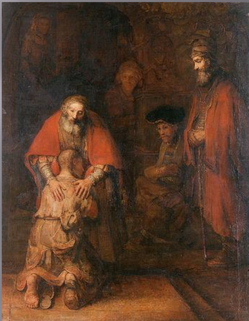
Рембрандт. Возвращение блудного сына. Эрмитаж. Санкт-Петербург