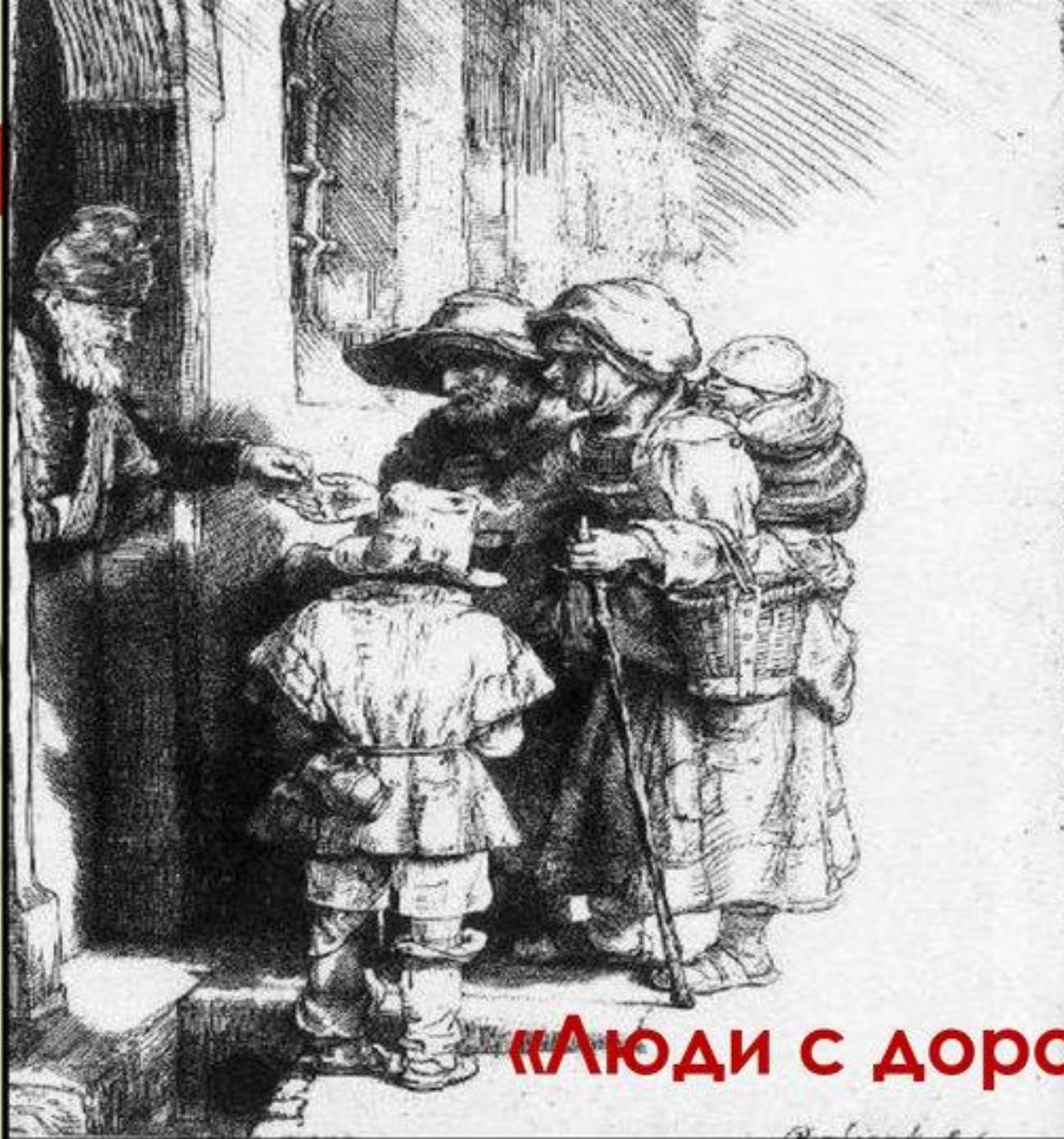
Нищие, получающие милостыню у двери дома. (Рембрандт)