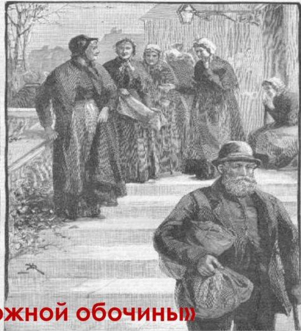
Покидая рабочий дом