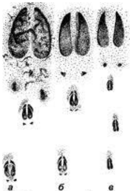
а б в Следы: а - лось, б - лосиха, в - теленок