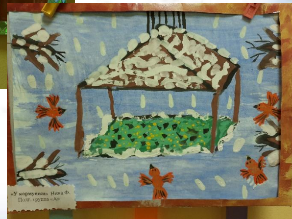
«У КОРМУШКИ НАКА Ф.» Подг. группа «А»