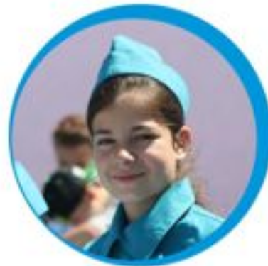
Юные инспекторы движения