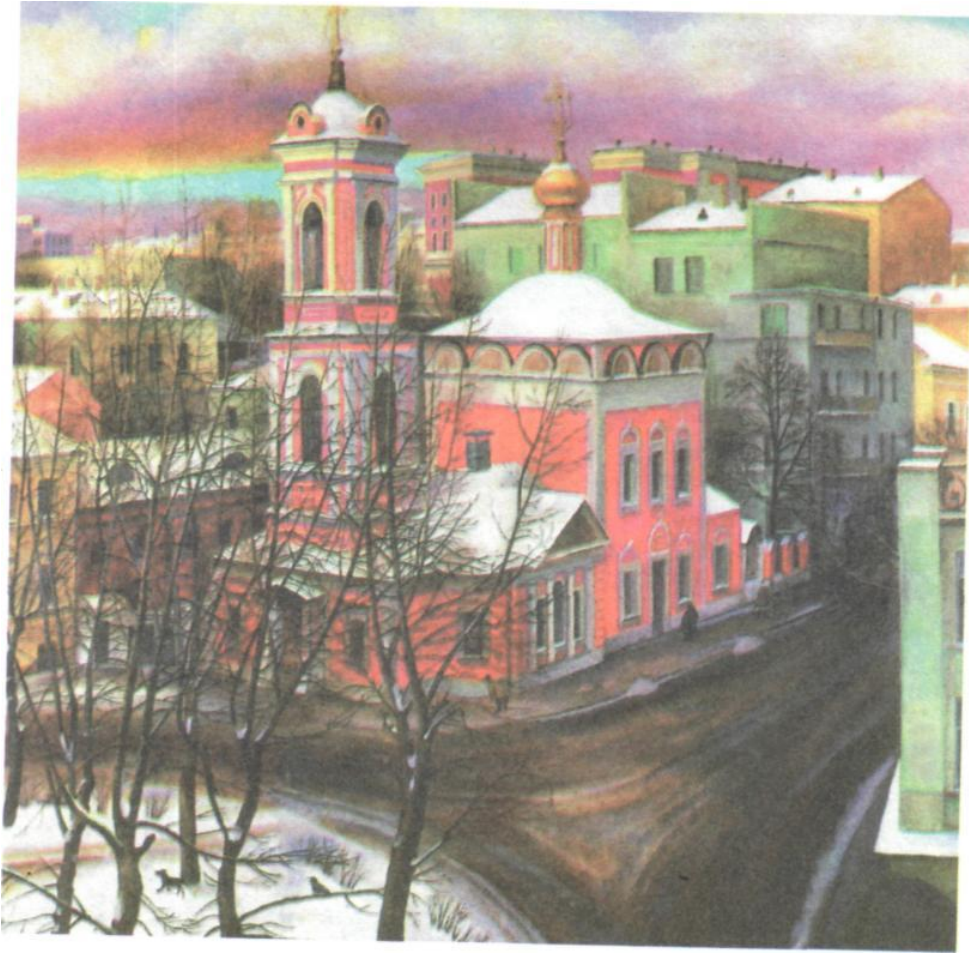
Т. Назаренко «Церковь Вознесения на улице Неждановой»