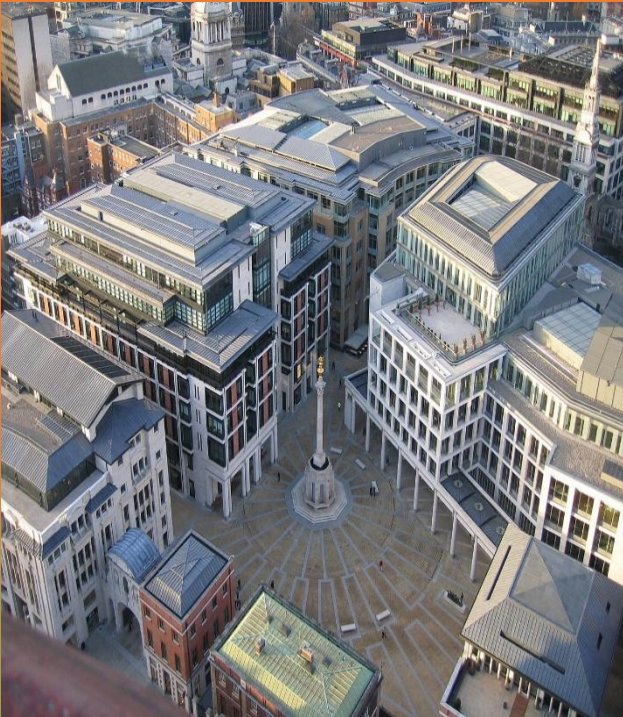
Лондонська фондова біржа