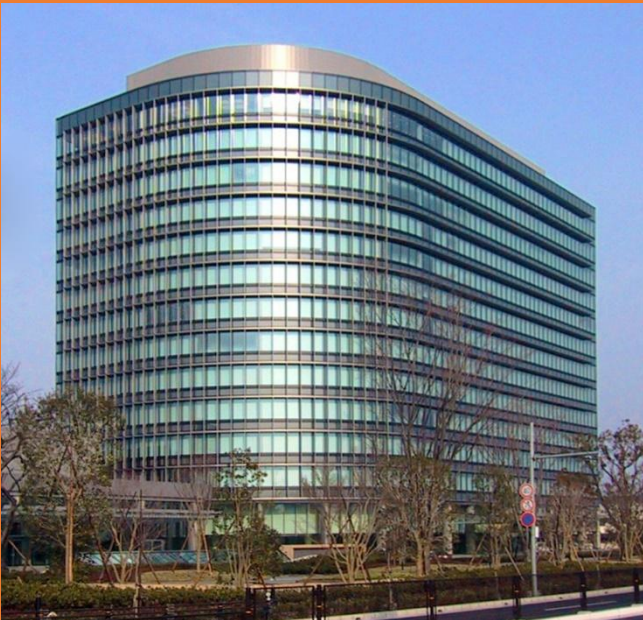
Toyota Motor Corporation