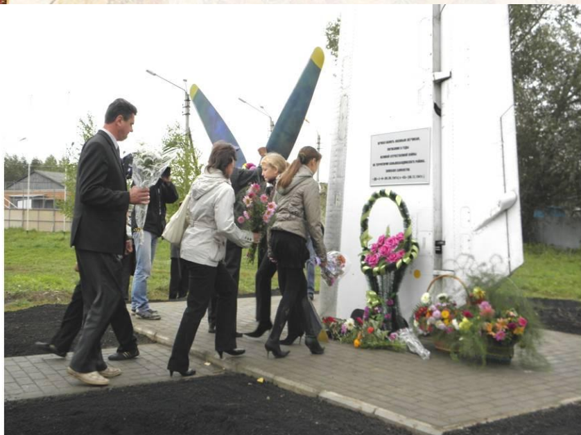
Открытие памятного знака «Погибшим Летчикам». Б.Болдино, 2011г.