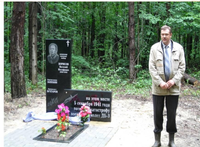
.Открытие памятника на могиле летчиков у п. Калинин. 2011г.