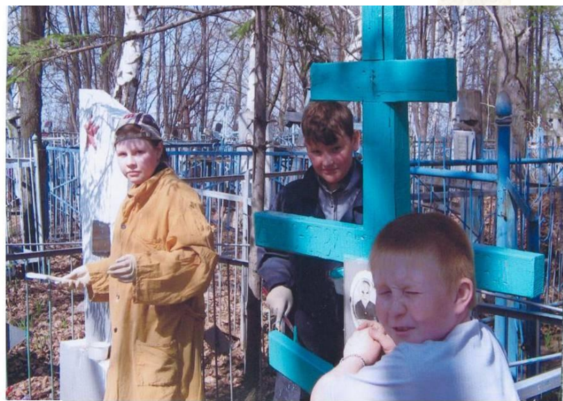
Обустройство могил В.А.Грехова и Е.И.Смолиной (покраска памятника, креста, ограды, уборка опавшей листвы). 2004г.