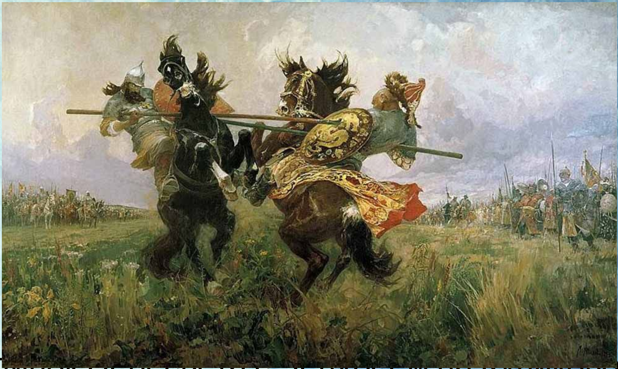
Поединок пересвета с телушем на Куликовом поле, М.И. Авилов