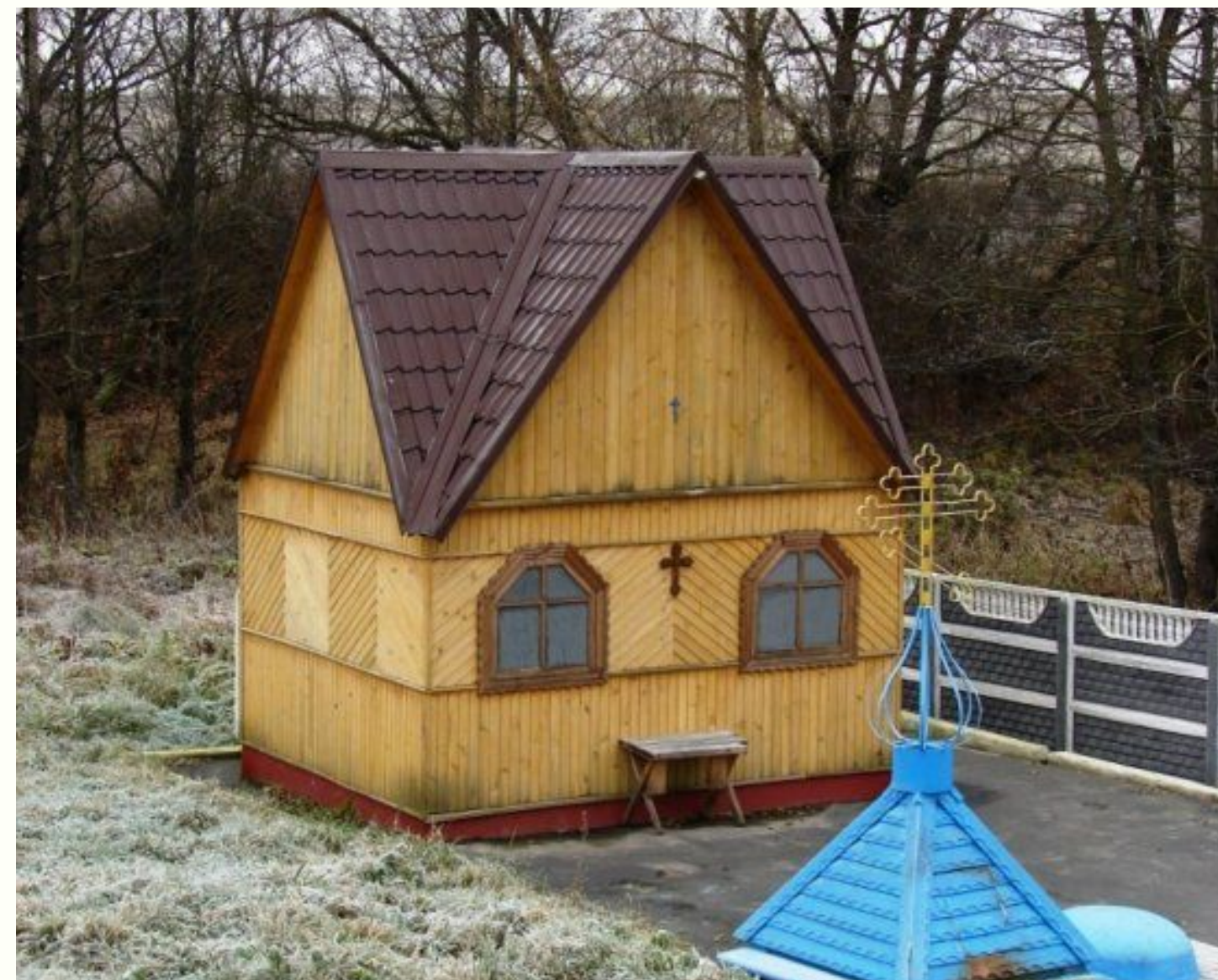
Брянская область, Любохна. Часовня иконы Божией Матери "Неупиваемая Чаша"

Заканчивается праздник к вечеру. Все желающие спешат набрать святой воды и окунуться в купели в честь иконы «Неупиваемая чаша», которая находится недалеко от храма-часовни, прямо на въезде в наш посёлок.