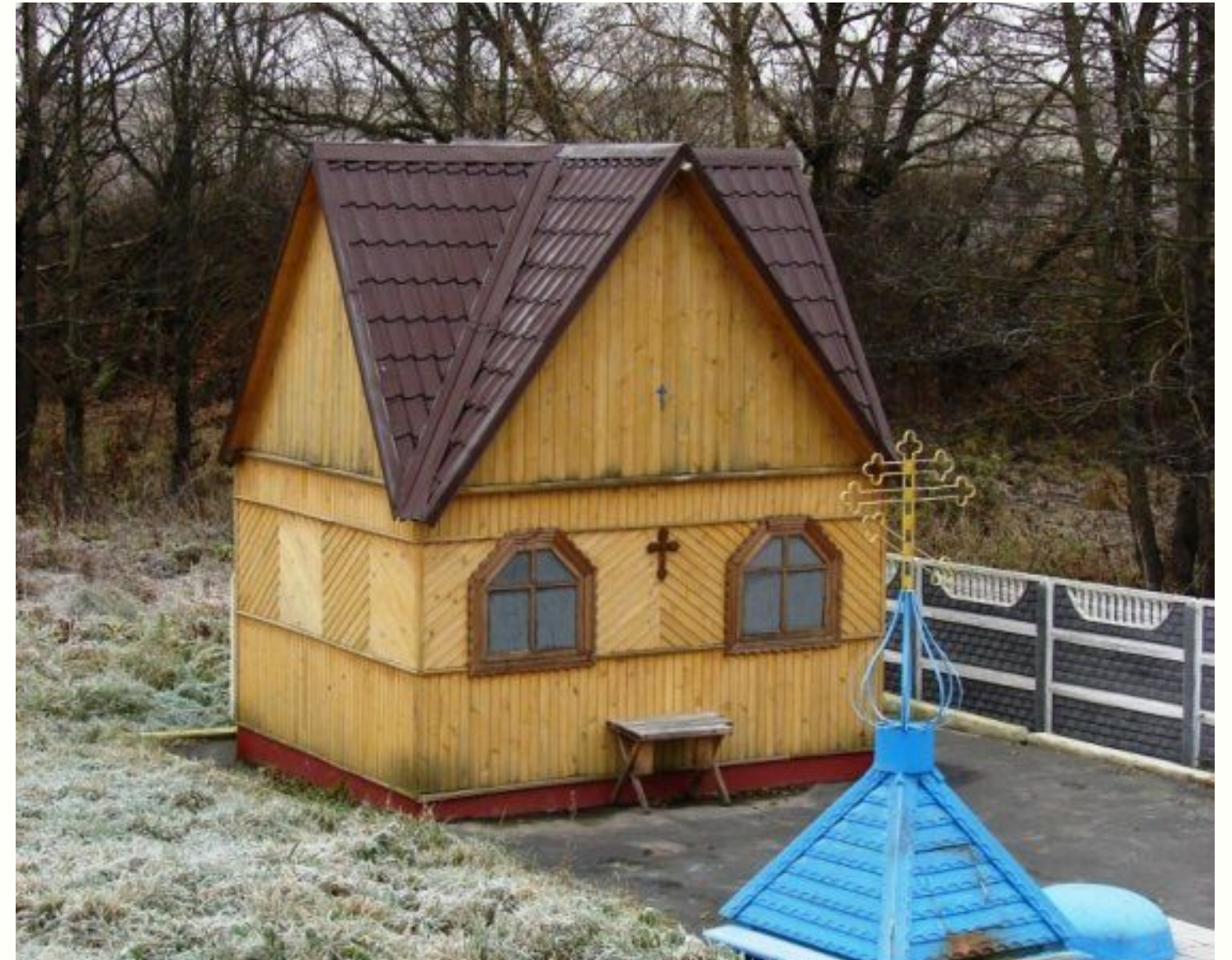
Брянская область, Любохна. Часовня иконы Божией Матери "Неупиваемая Чаша"

Заканчивается праздник к вечеру. Все желающие спешат набрать святой воды и окунуться в купели в честь иконы «Неупиваемая чаша», которая находится недалеко от храма-часовни, прямо на въезде в наш посёлок.