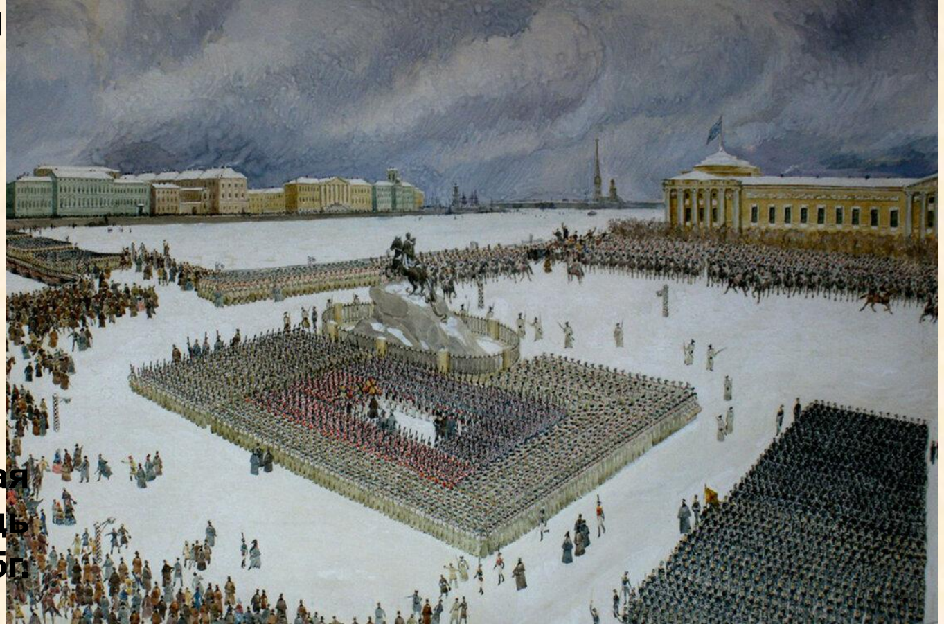
Сенатская площадь 14 декабря 1825г