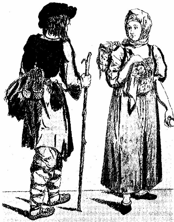
К. А. Зеленцов. Крестьянин и крестьянка. Офорт. XVIII в.