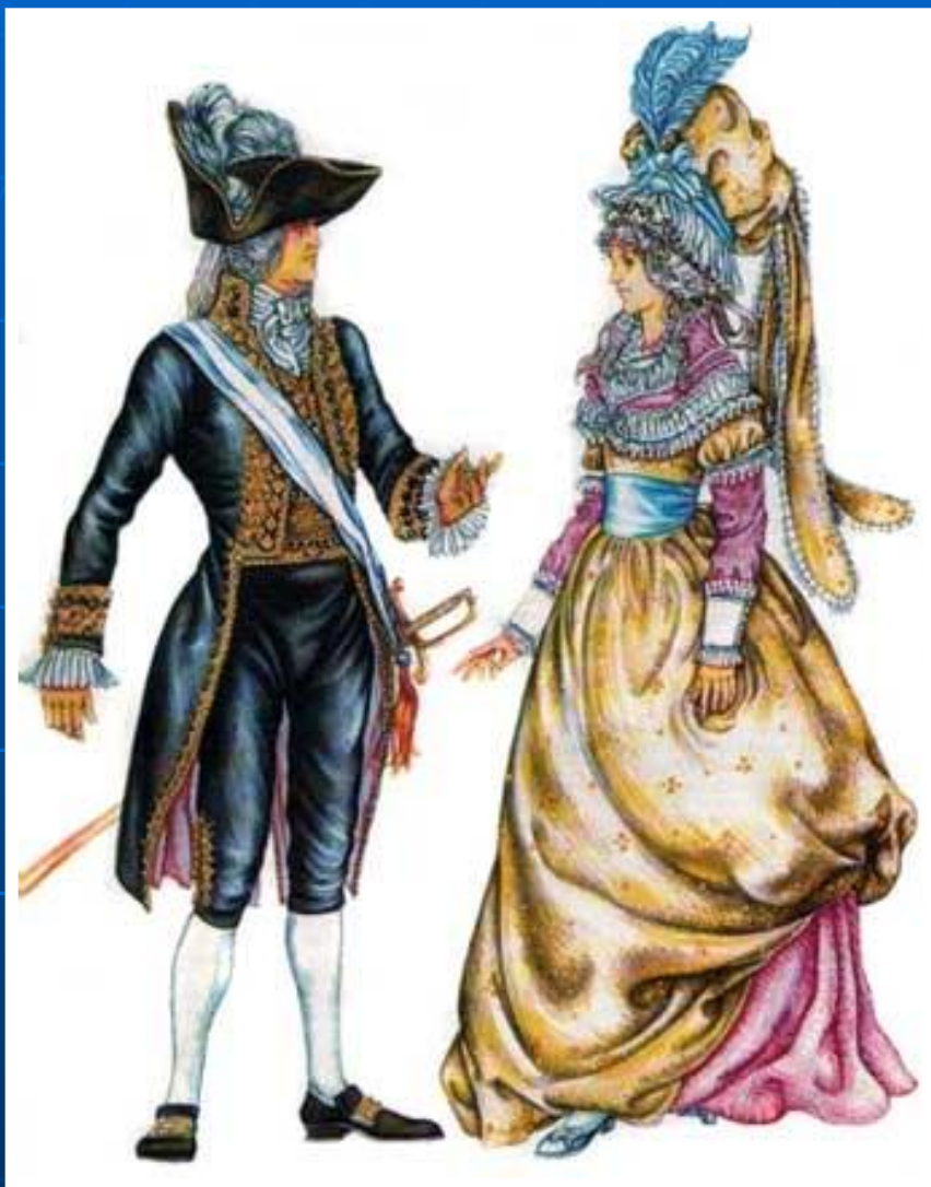
Костюм периода Великой Французской Революции.