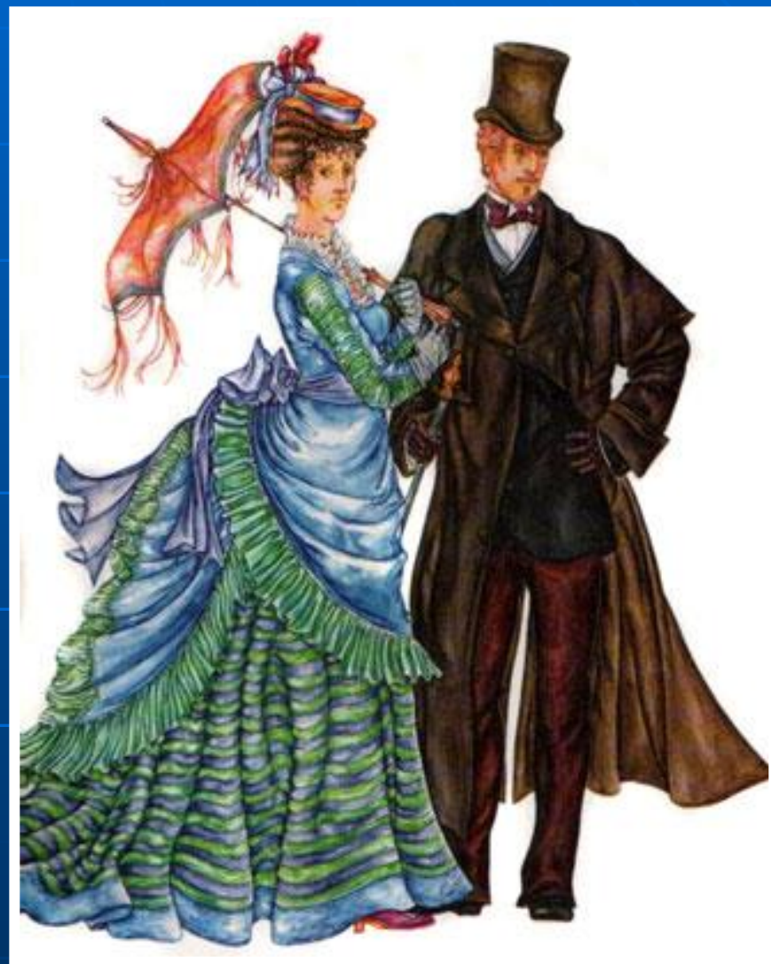
Западноевропейский костюм XIX века