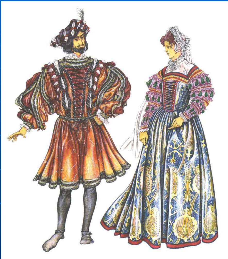
Испанская мода XVI века