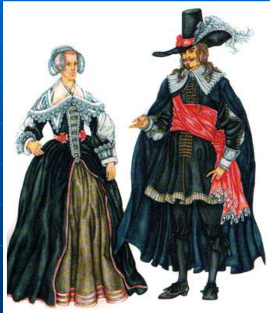
Костюм Голландии XVII века