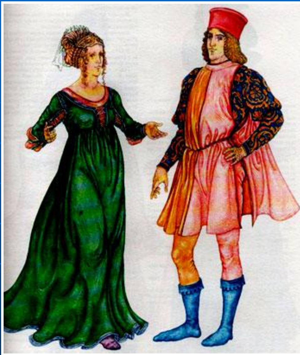
Костюм эпохи Возрождения Италия