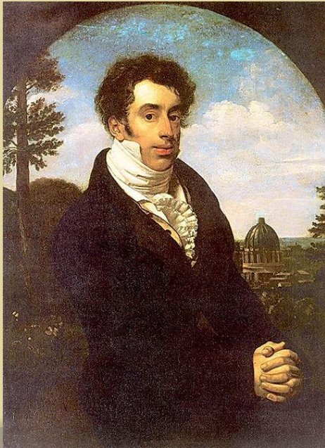
Портрет князя А.М. Голицина