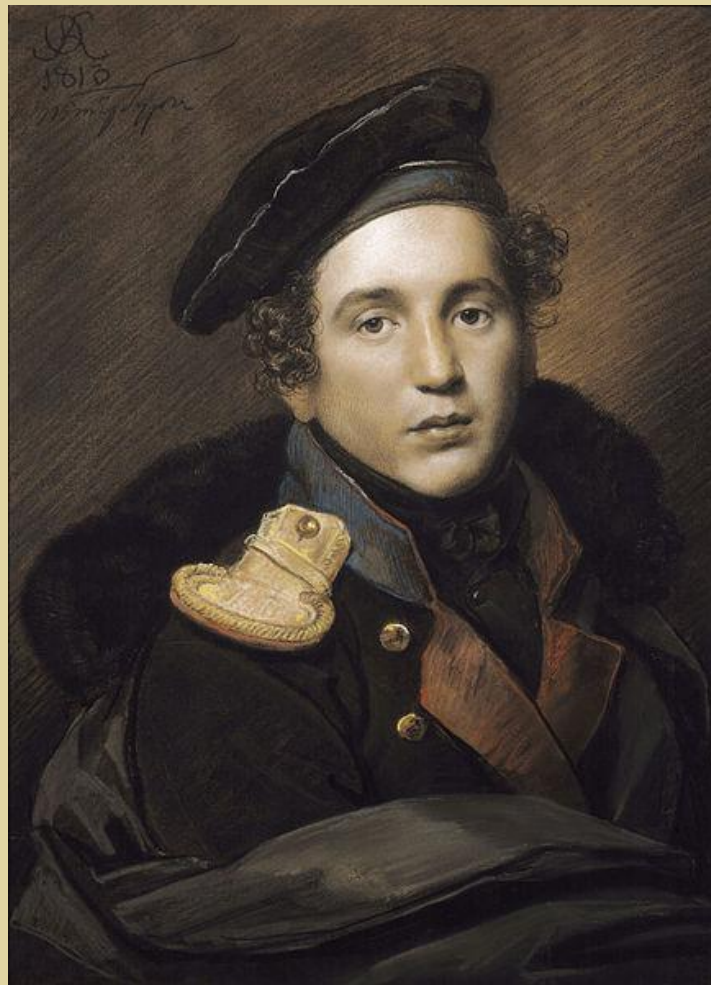
Портрет А.Н. Оленина