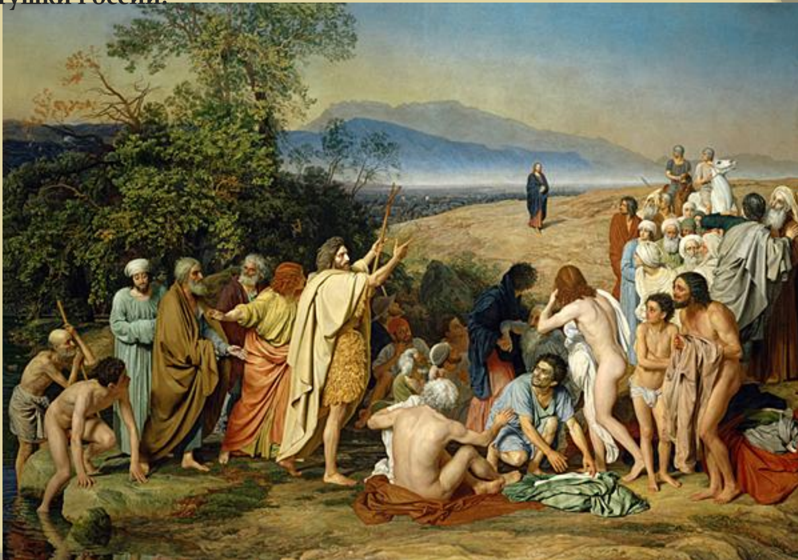
«Явление Христа народу»

всегда стремился показать в своих произведениях стихию народных движений в русской истории и глубоко верил в великое будущее матушки России.