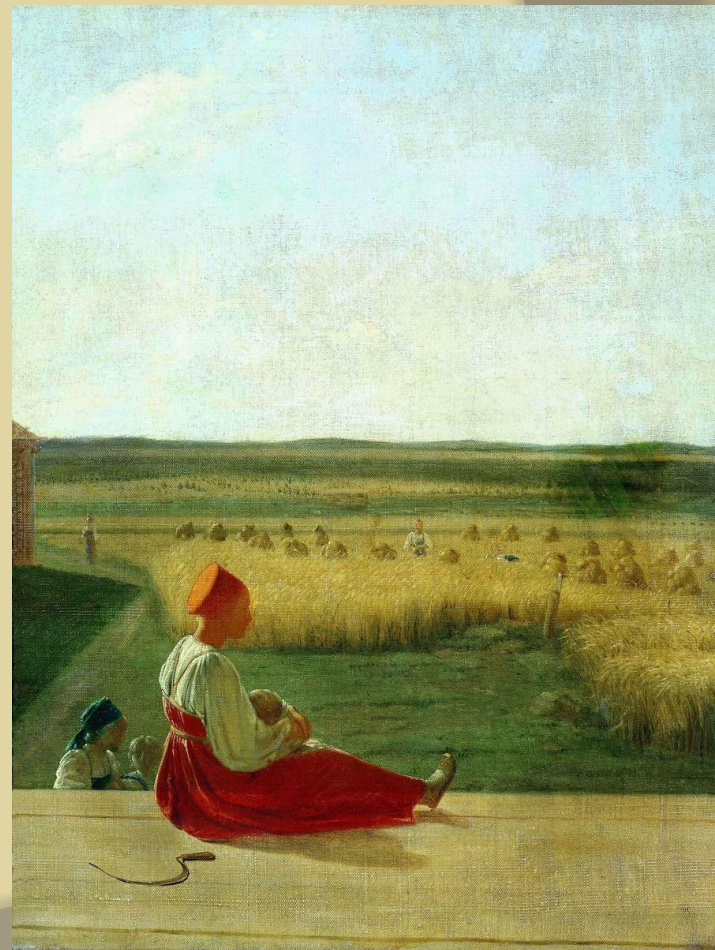
«На жатве. Лето»