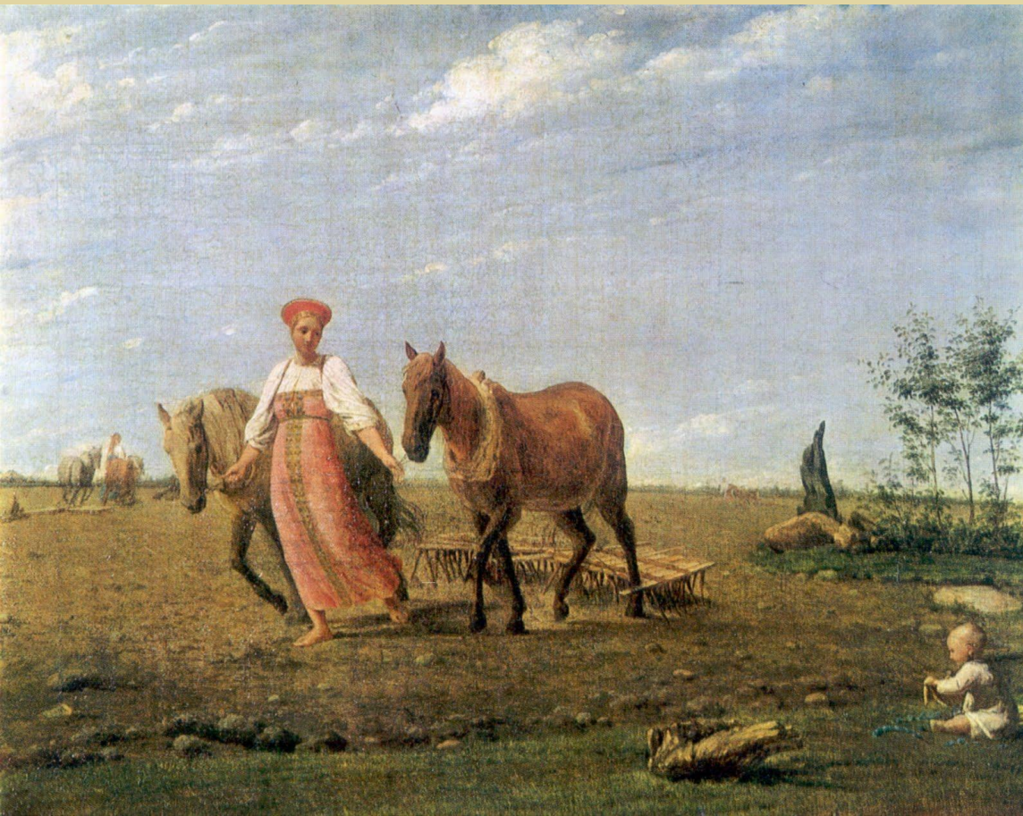
«На пашне. Весна»

Картины были посвящены повседневному труду и быту крестьян