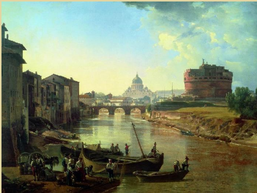
«Новый Рим, замок Св. Ангела, 1825 г.»

мастер пейзажного романтизма и лирического осмысления природы