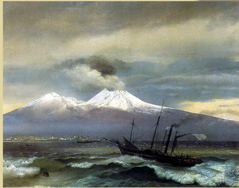
«Вид Везувия в зимнее время»