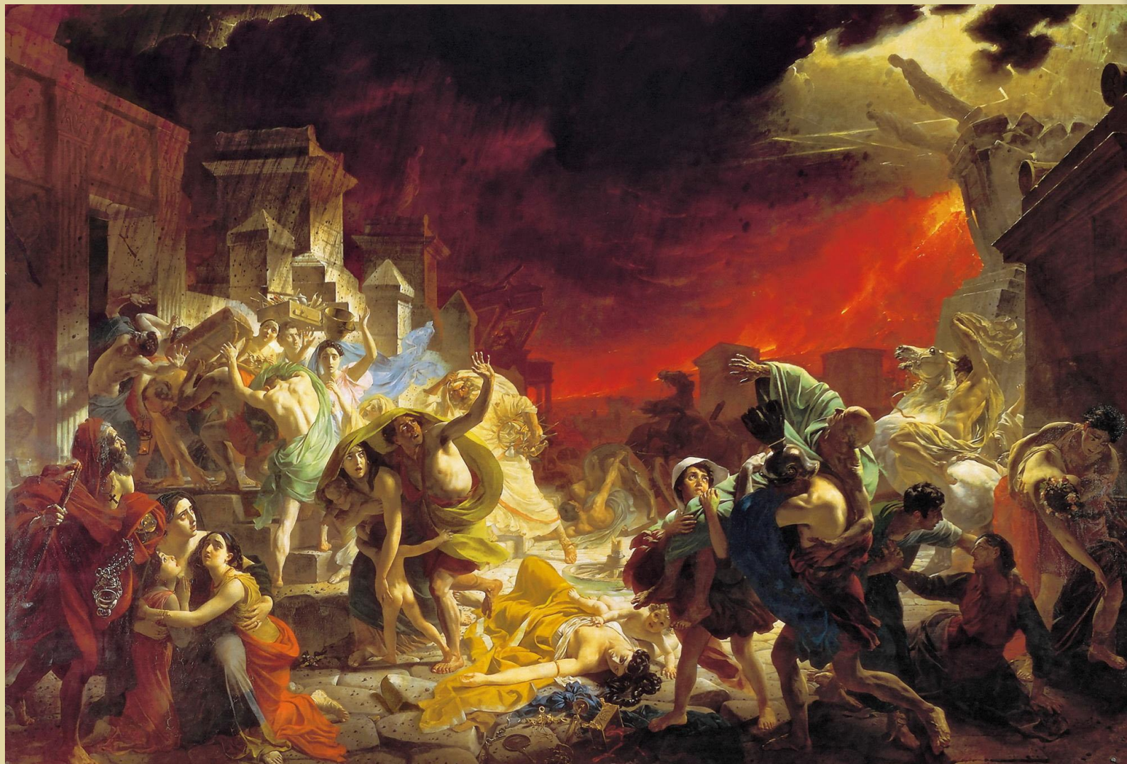
«Последний день Помпеи»

впервые в качестве героя представил народ