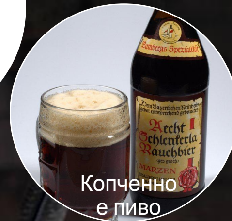
Копченно е пиво