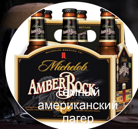
Амбер Рок американский лагер