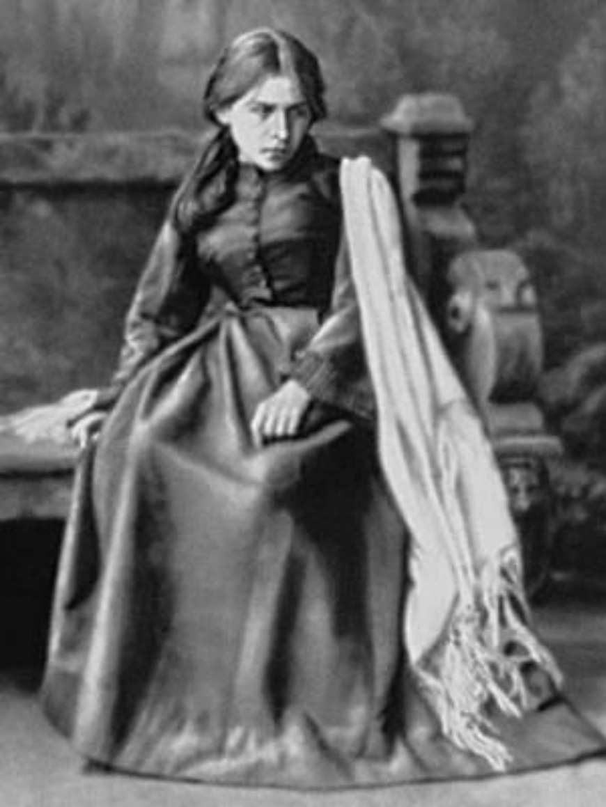
П.А. Стрепетова в роли Катерины