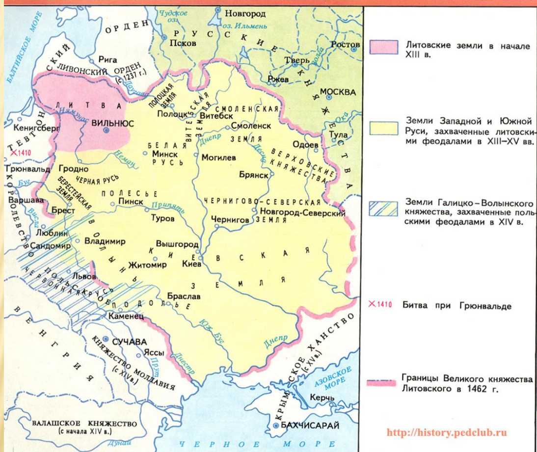
ЗАПАДНАЯ РУСЬ В СОСТАВЕ ВЕЛИКОГО КНЯЖЕСТВА ЛИТОВСКОГО В XIII–XV ВВ.