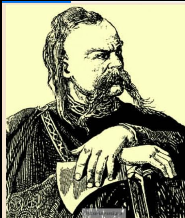
Князь Святослав Игоревич