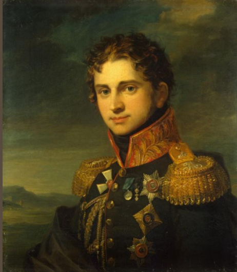
Граф П.А. Строганов

Главным результатом деятельности Негласного комитета должно было стать ограничение самодержавия.