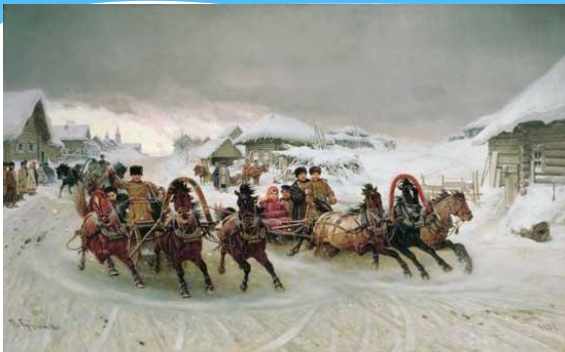
Семен Кожин «Масленица. Проводы». Россия, XVII век.