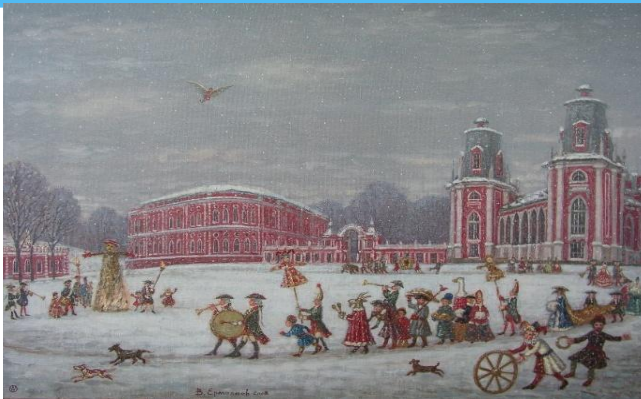
Ермолаев В.Ю. «Масленица в Царицыно», 2008.