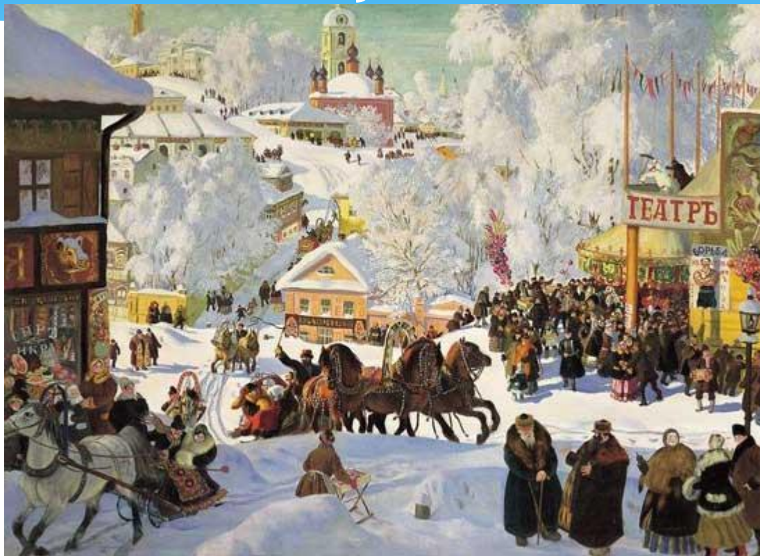
Б. Кустодиев «Масленица», 1919г.