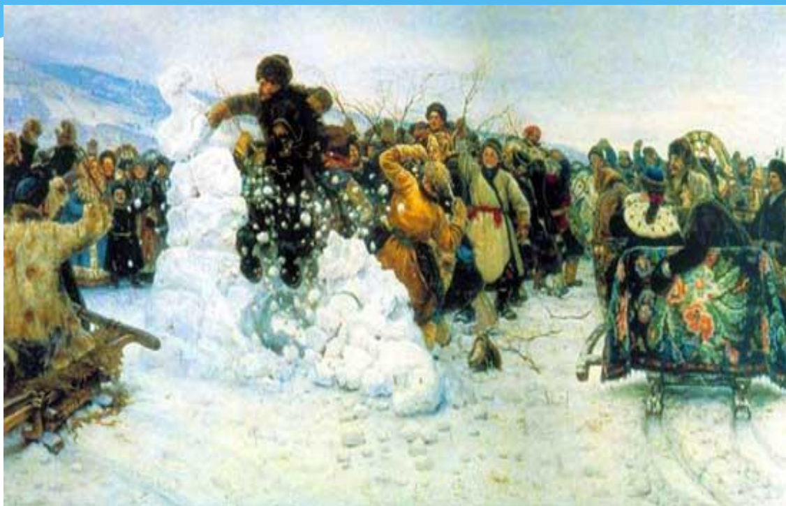
В.И.Суриков «Взятие снежного городка».