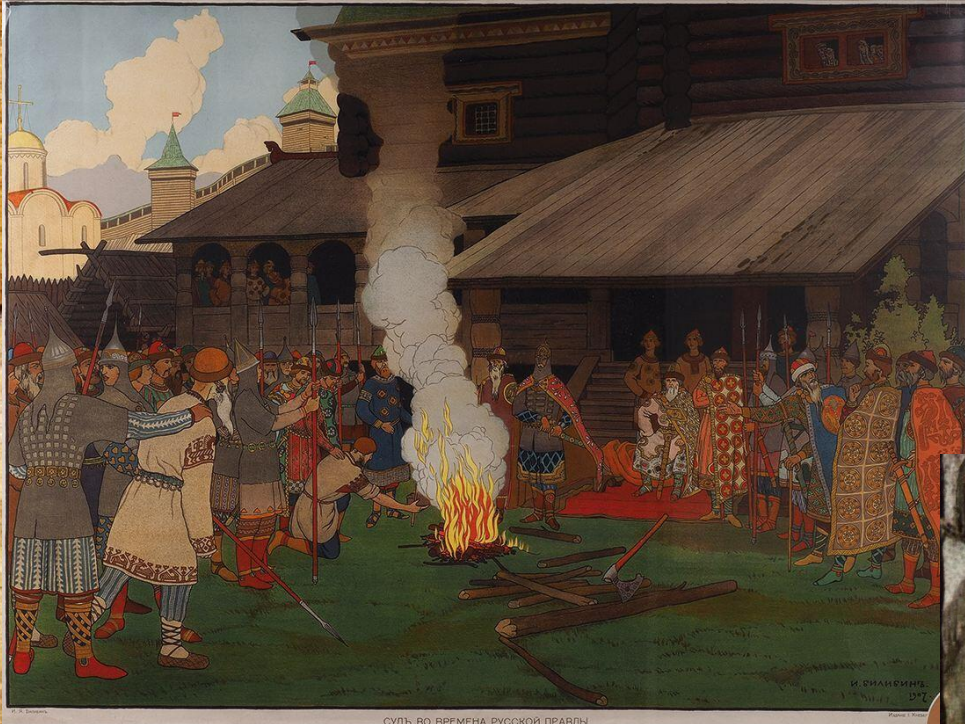
СУДЬ ВО ВРЕМЕНА РУССКОЙ ПРАВДЫ.