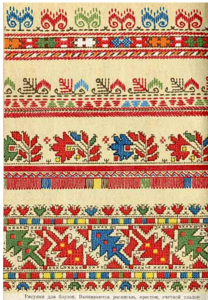
Рисунки для блузок. Вышиваются росписью, крестом, счетной гладью.