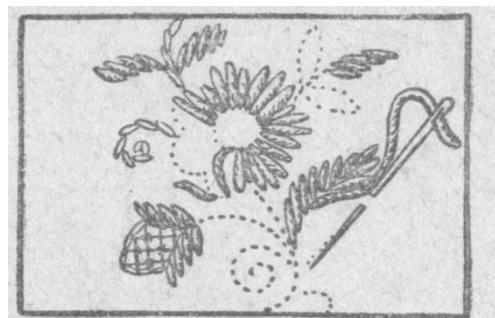
Рис. 40. Владимирский шов.