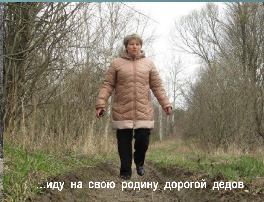
...иду на свою родину дорогой дедов