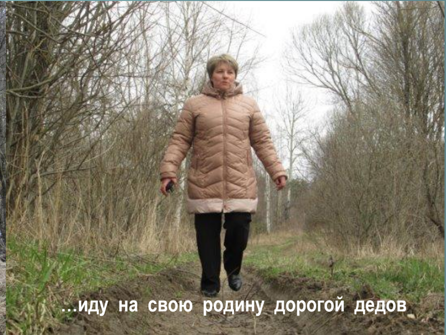
...иду на свою родину дорогой дедов

В детстве я не раз гостила летом в деревне Граковка расположенной вдоль речки Доргомысль. В то время ещё хорошо сохранились самобытные традиции и уклад, певучий язык белорусского народа, «вечное эхо» - любви и памяти о трагедии и подвиге сложивших свои головы на войне. Эти воспоминания я пронесла через всю свою жизнь. Тогда были живы родные братья деда, их жёны, сестра и братья моей мамы и вторая жена деда баба Маричка.