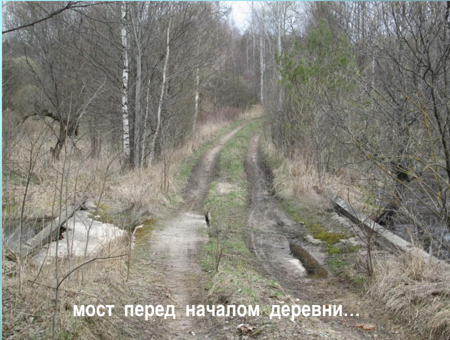
мост перед началом деревни...