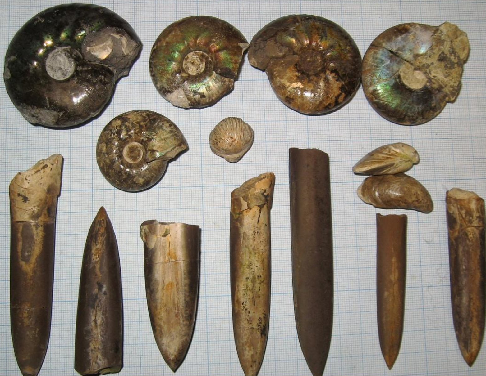
Останки аммонитов и белемнитов в сызранском музее