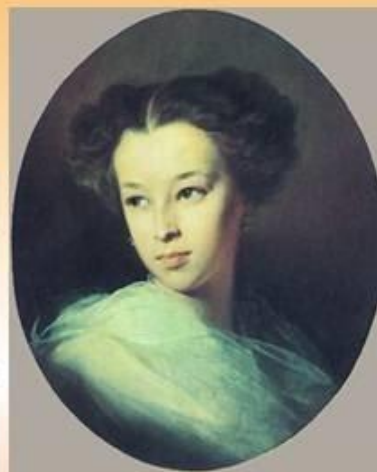
Младшая дочь Наталья Александровна Пушкин (1836-1913г.)