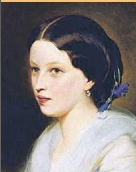
Старшая дочь Мария Александровна Пушкина (1832-1919г.)