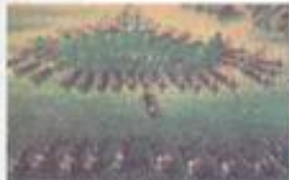
Гангутская сражение. Словоса XVIII в