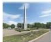
Башкирский Драматический театр