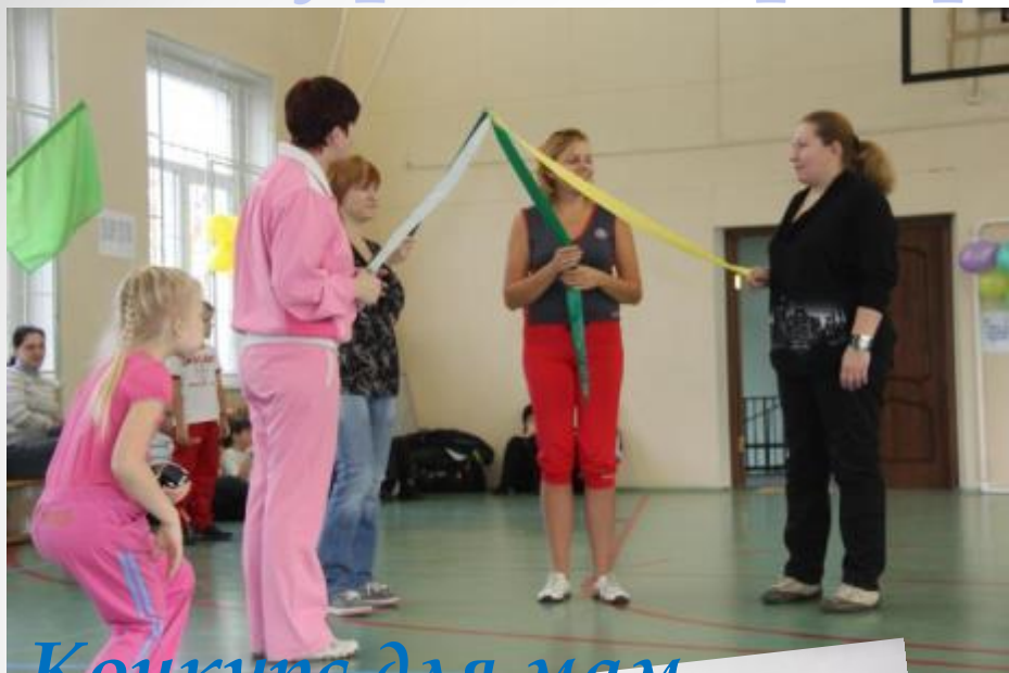
Конкурс для мам