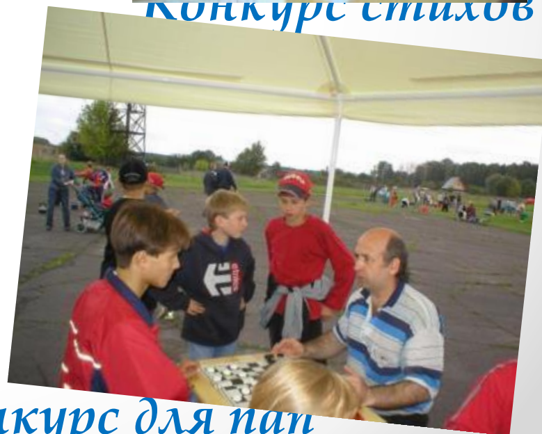
Конкурс для пап