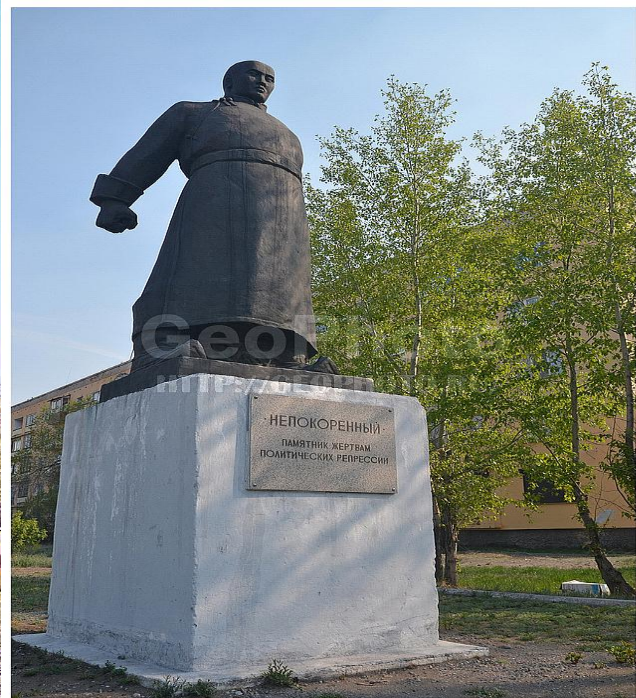
# skrb213129921 Tuva, Russia, Southern Siberia