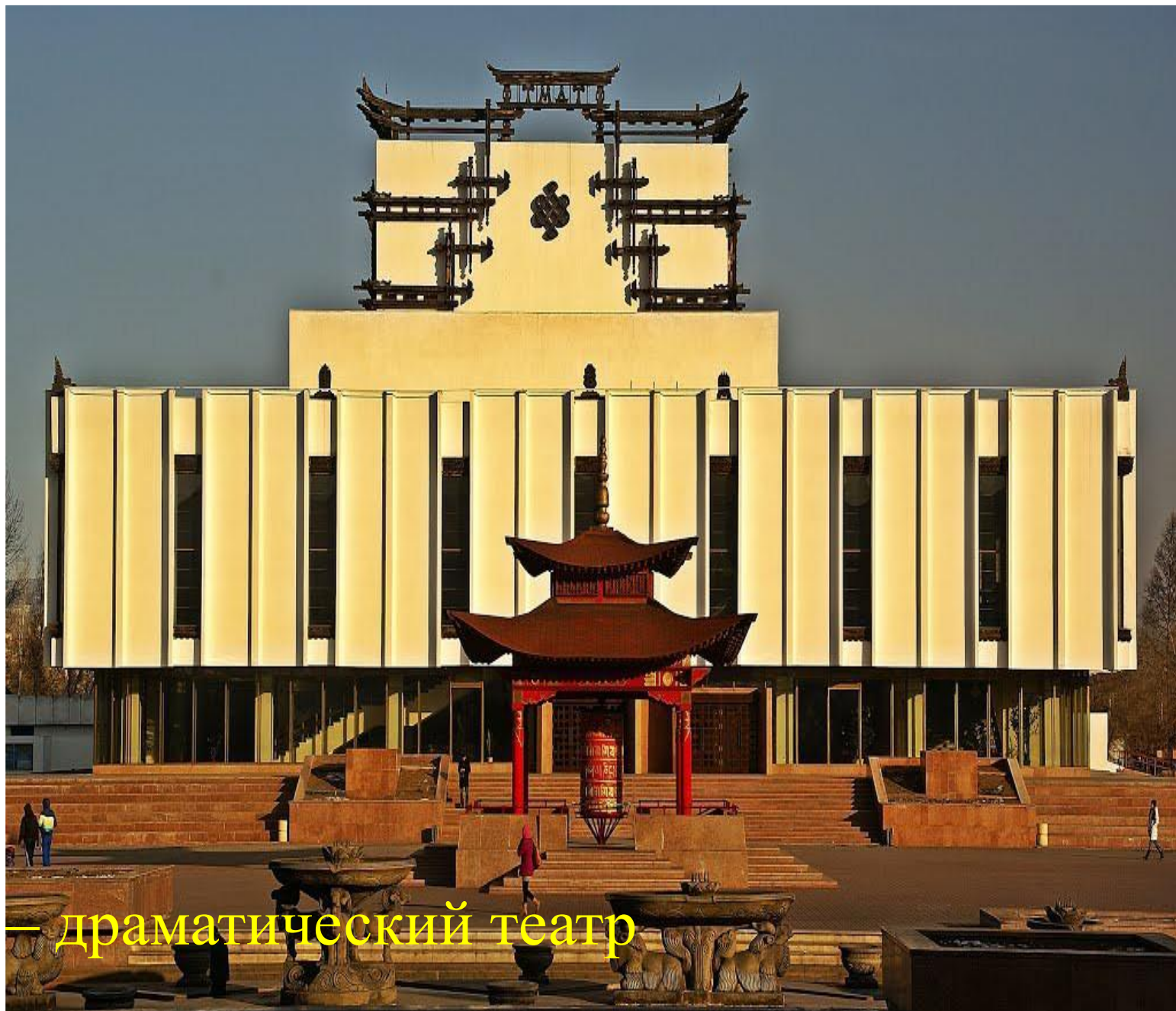
Музыкально — драматический театр