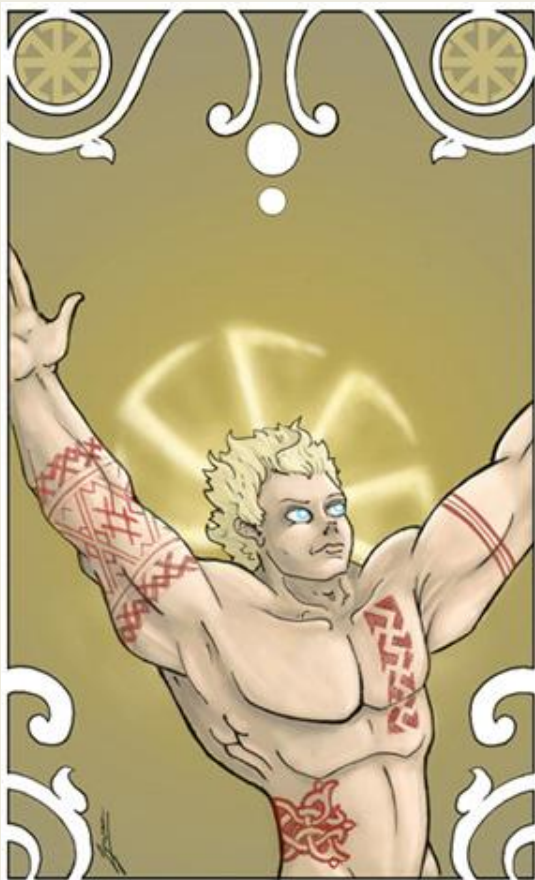
Dažbog bůh Slunce