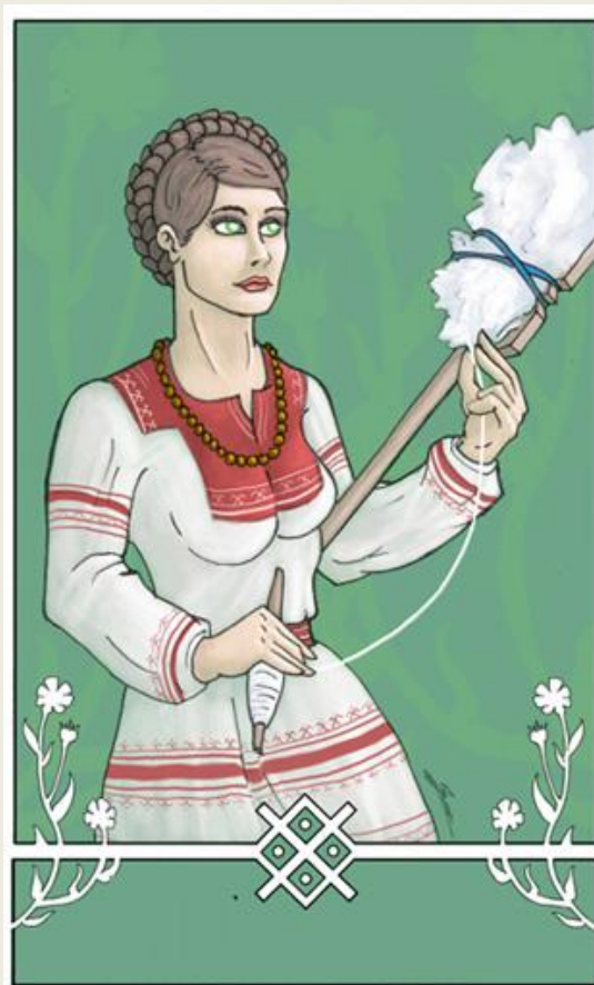
Mokoš bohyně země a vody