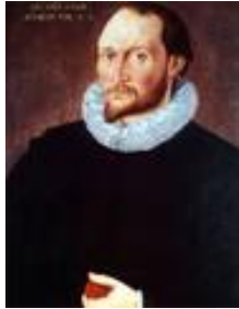
Гарриот (Thomas Harriot 1560-1621)