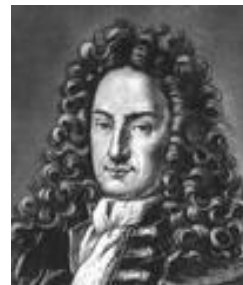
Г. Лейбниц (G. Leibniz 1646-1716 )