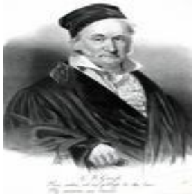
Карл Гаусс (Carl Gauss 1777-1855)