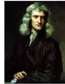
И. НЬЮТОН (Isaac Newton 1643-1727)