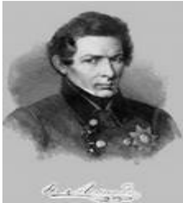
Н. И. Лобачевский

«Русский математик(01.12.1792 - 24.01.1856), творец неевклидовой геометрии»