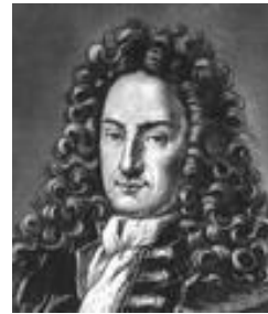
Г. Лейбниц (G. Leibniz 1646-1716 )