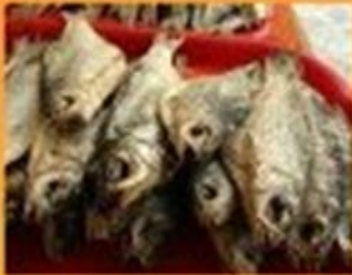
Сушёная рыба (Исландия)