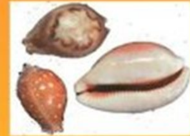
Раковины Каури (Приморье)