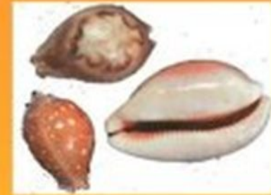
Раковины Каури (Приморье)