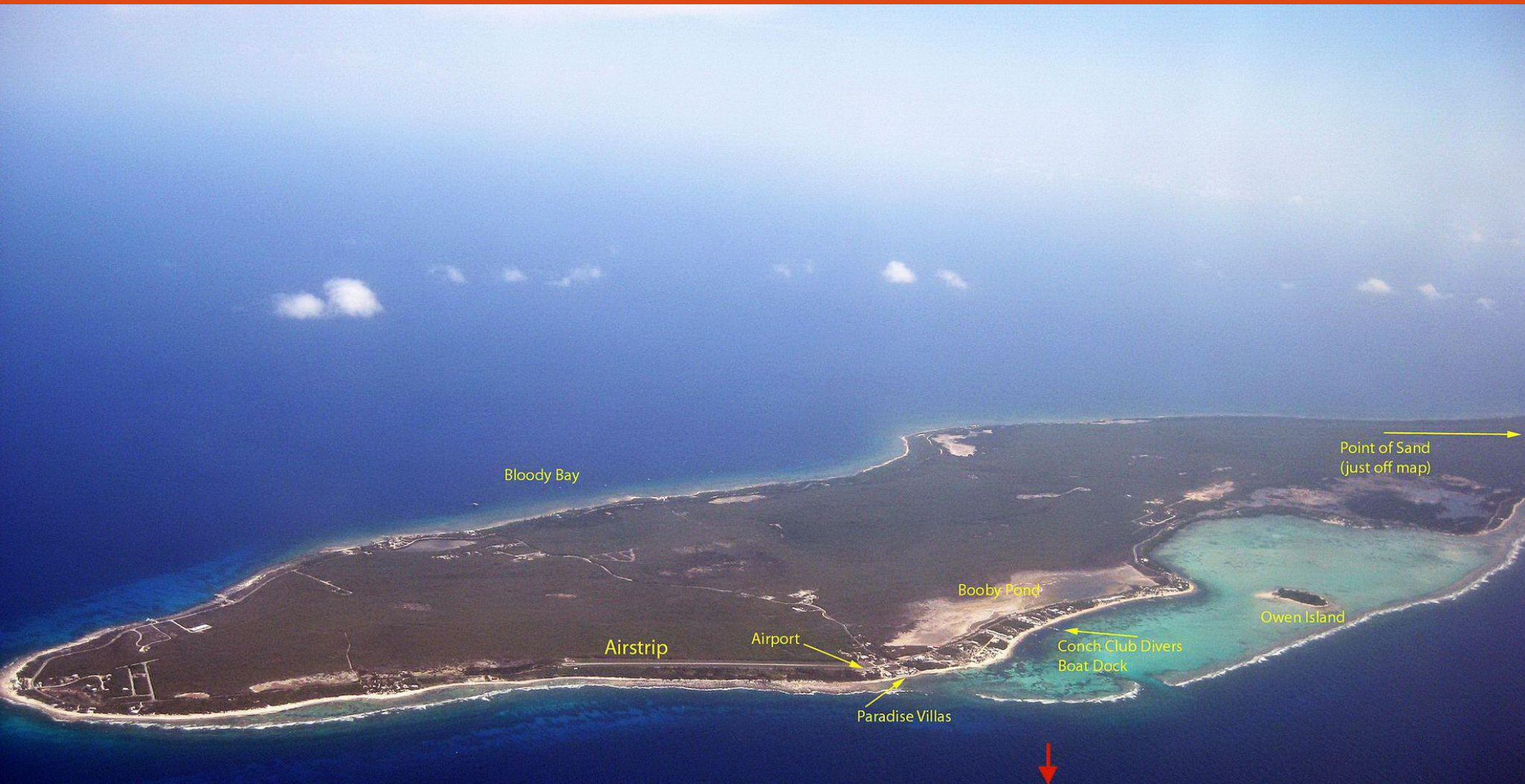
Little Cayman Aerial View