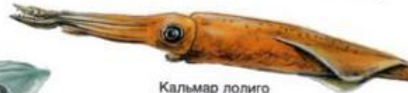
Кальмар лолиго (75 см)