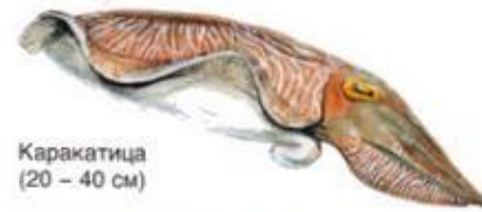
Каракатица (20 – 40 см)