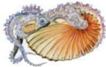
Аргонавт (25 см)