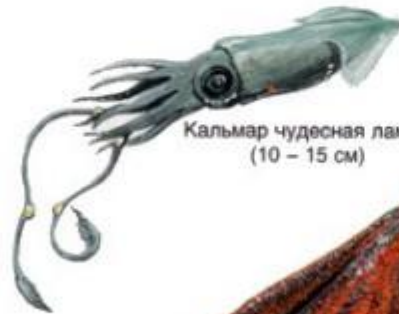
Кальмар чудесная лампа (10 – 15 см)