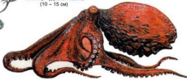
Осьминог дальневосточный (до 2,5 м)