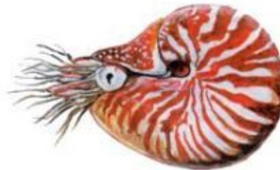
Наутилус (до 30 см)