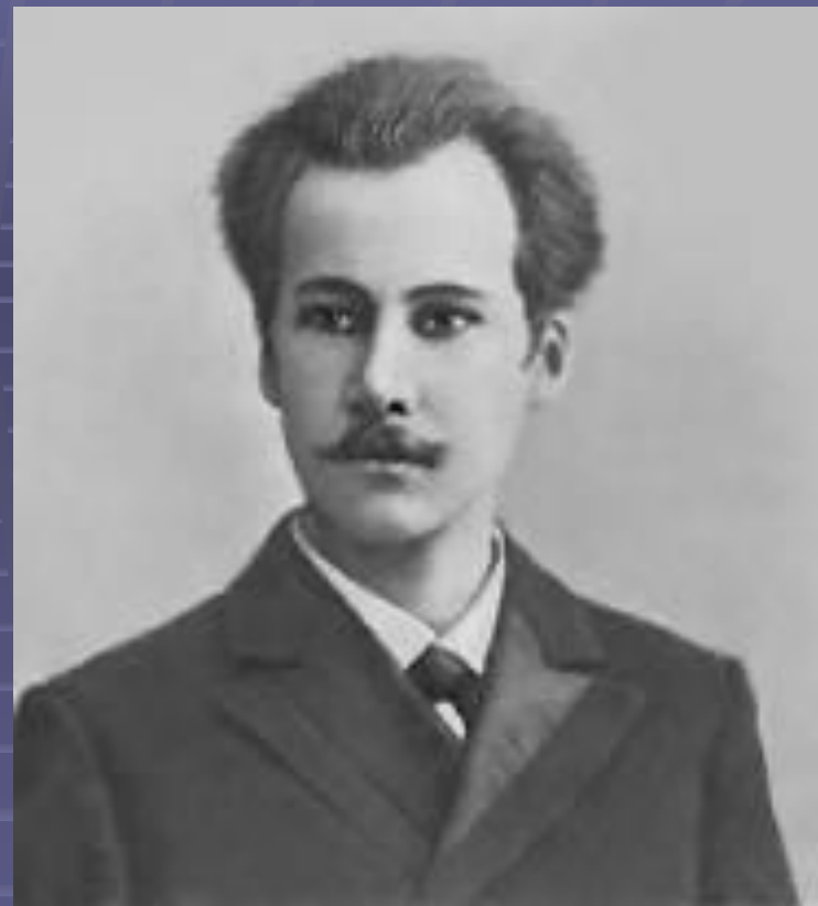
Андрей Белый, (наст. имя Бугаев Борис Николаевич) (1880-1934)