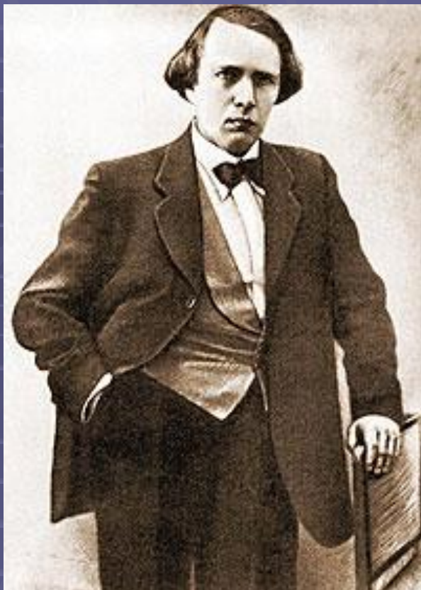
Толстой Алексей Николаевич (1883–1945)