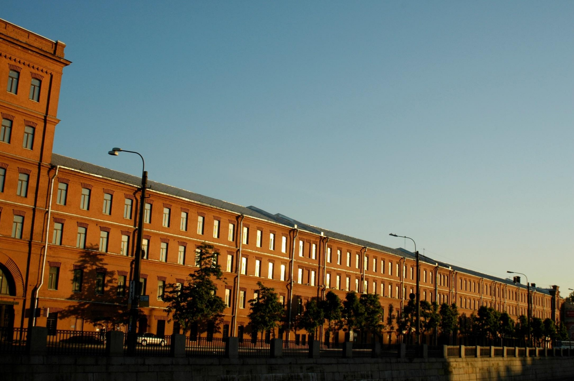
Панорама Обводного канала – «Треугольник»