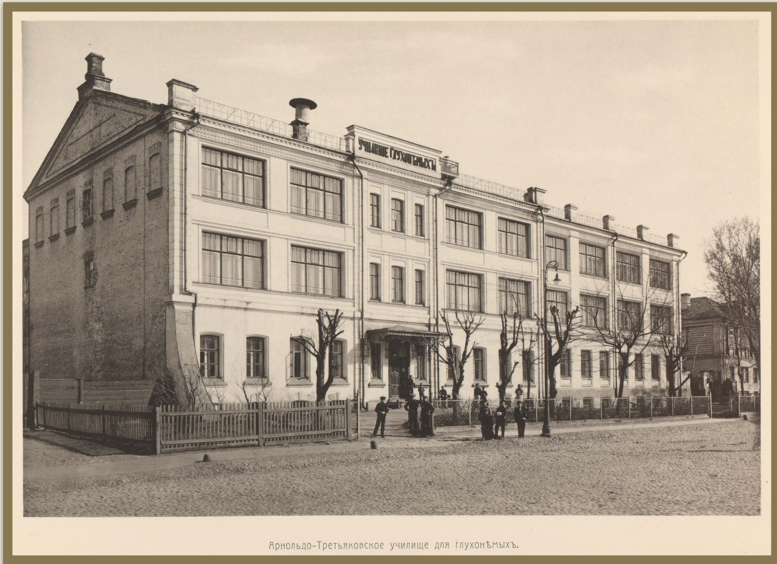
Арнольдо-Третьяковское училище для глухонѣмыхъ.