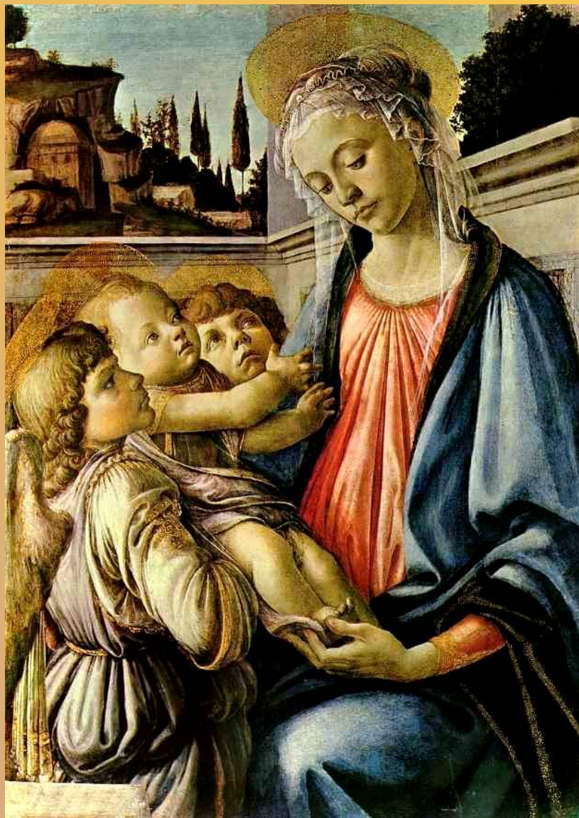
«Мадонна с Младенцем и ангелами», 1470