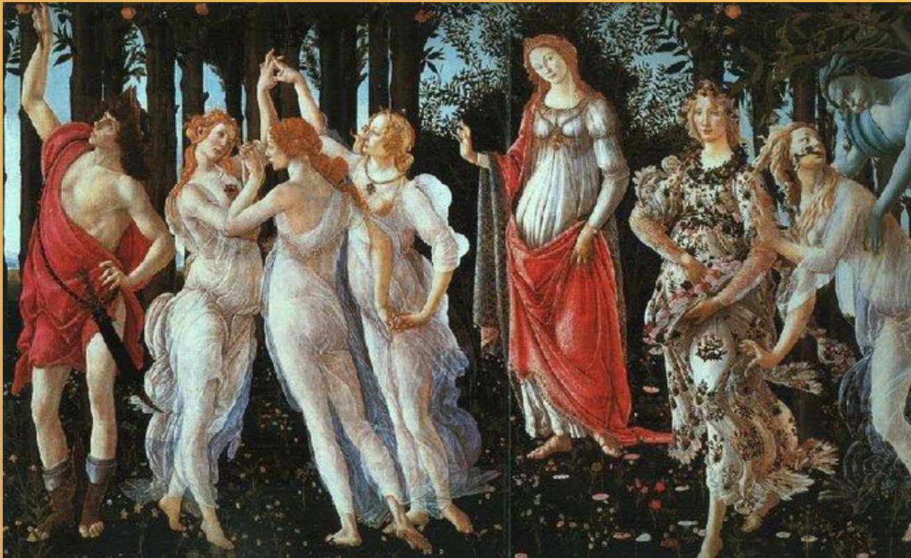
«Весна», около 1477-1478