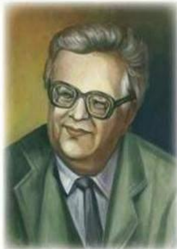
Берестов Валентин Дмитриевич (01.04.1928-15)

детский писатель и поэт. Он научился читать в четыре года, с нетерпением ожидал свежие номера детских журналов «Чиж» и «Дружные ребята». Валентин Берестов увлекался археологией. Принимал активное участие в раскопках Великого Новгорода. Первые строки для малышей написал, когда появилась на свет его маленькая дочь. Он считал, что язык детства – язык радости и чистоты. Валентин Берестов много стихотворений написал о школьной поре. Свои впечатления от археологических поездок он включил в повести «Приключений не будет», «Меч в золотых ножнах», «Каменные зерна».