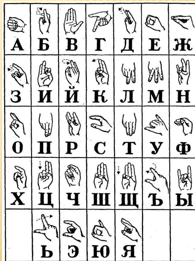
Рис. 5. Русский дактильный алфавит для глухих

Каждой букве алфавита соответствует особое положение пальцев.