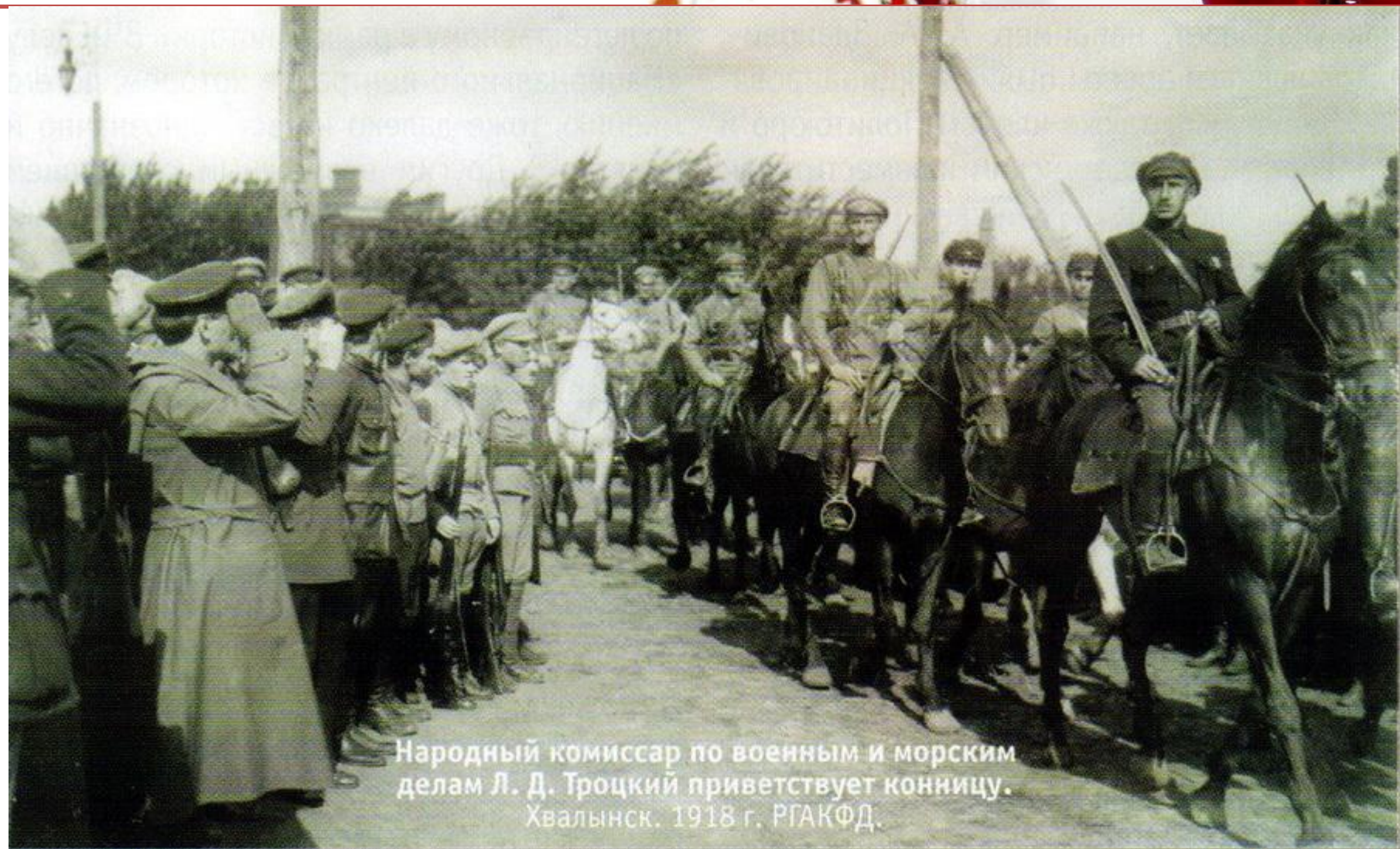
Народный комиссар по военным и морским делам Л. Д. Троцкий приветствует конницу. Хвалынский. 1918 г.