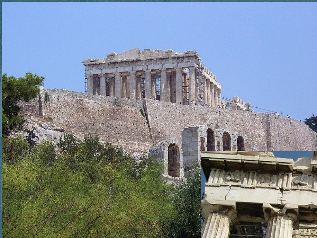
Храм Афины- Воительницы (Парфенон)